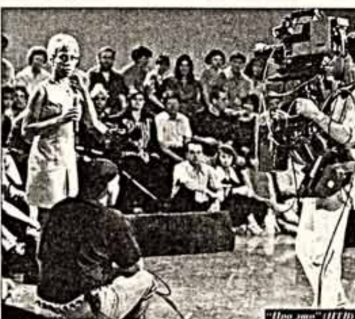
«Про это» (ТВ-Центр)

будет" — на это до первого ноября есть универсальное оправдание — канал "Культура". Одним из главных приоритетов Российского канала в новом сезоне стали трансляции. Как показывает практика, этот жанр и высокий рейтинг позволяют иметь, и особой выдумки не требует.