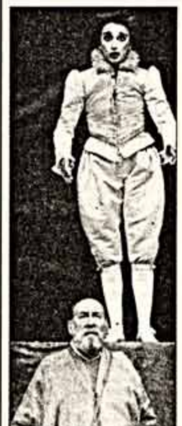
Сцена из спектакля "Буря"