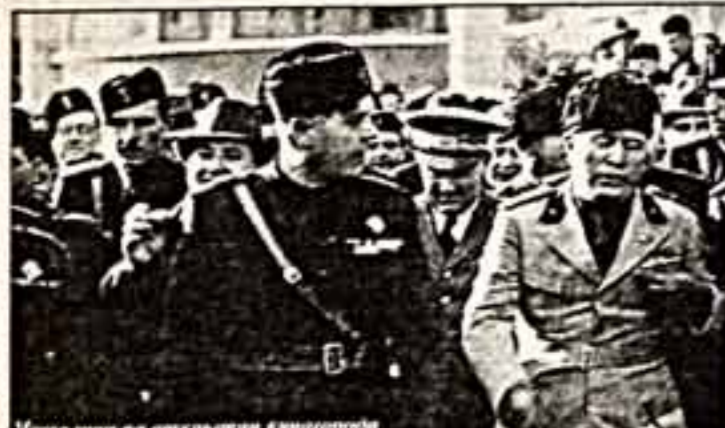
Иллюстрация по иллюстрированному