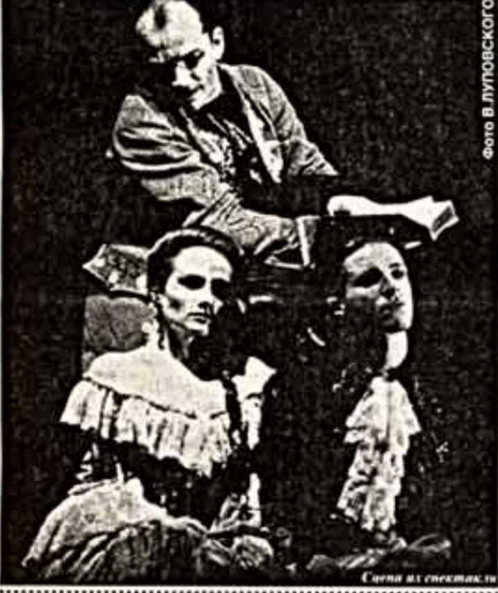
Слева в галерее.