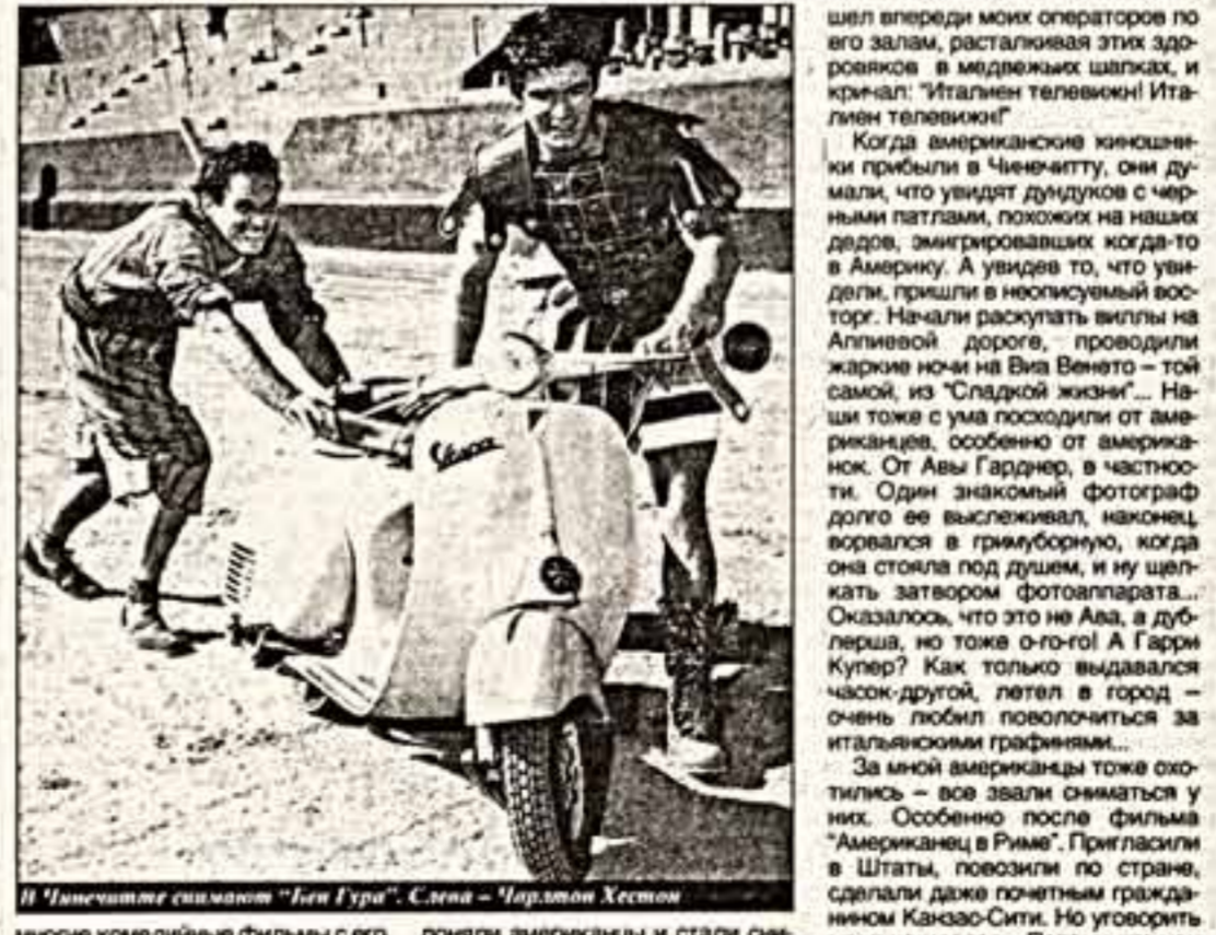
В Чинчигетте снимали "Ева Перон". Сцена - Чарльот Хестон