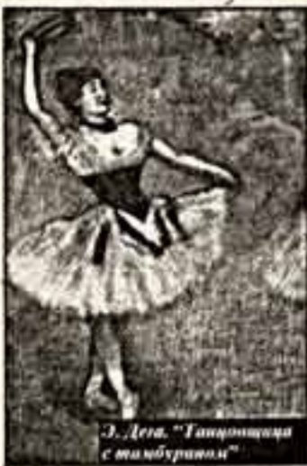
Э. Дега. "Танцовщица с тапачином"

Предварительная выставка "Кристи", об открытии которой сообщалось в прошлом номере газеты, завершилась. Ее прежде всего следует рассматривать как событие дипломатическое и как знак приближения России к европейскому культурному миру.