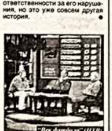
«Век футбола» (ТВ-Центр)

Тремя китами сегодняшнего Российского телевидения являются — сериалы, ток-шоу и игры. Первый "кит" представлен на "ТВ-Центре" достойным всероссийского восхищения кинопанелем "Слезы-женихи".