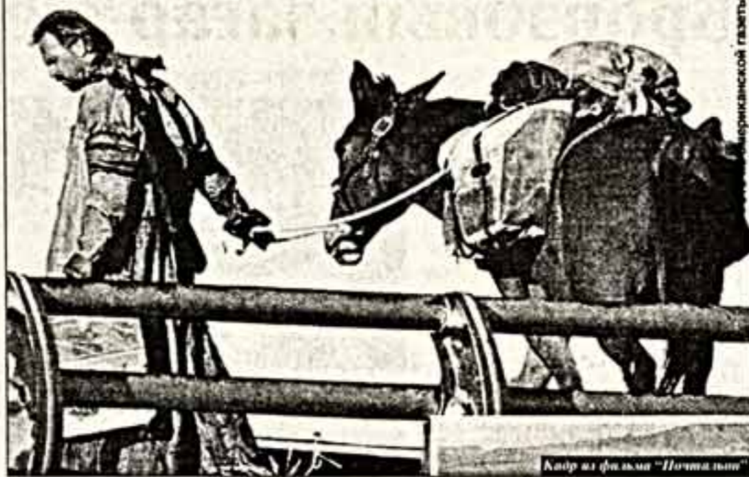
Кадр из фильма "Почта лань"