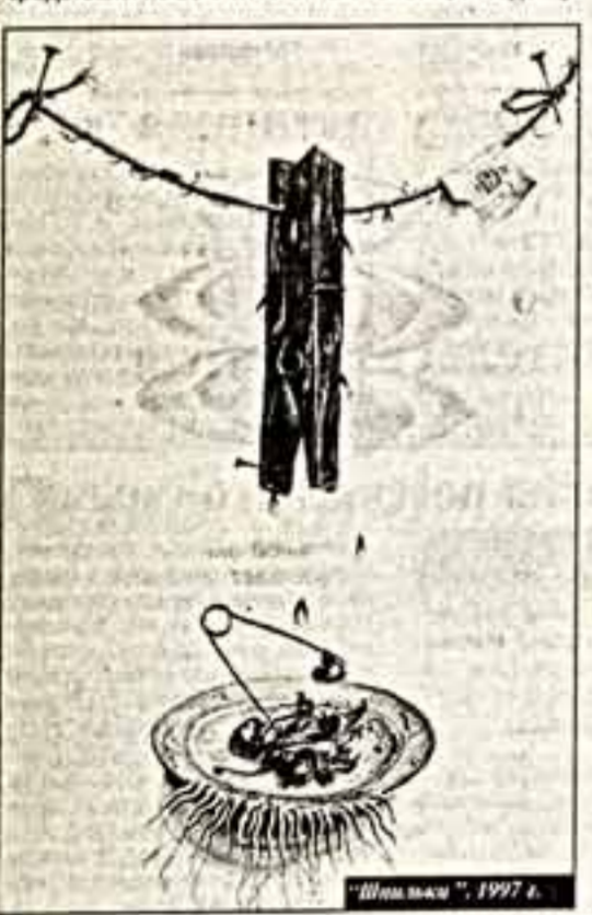
"Шляпка", 1997 г.