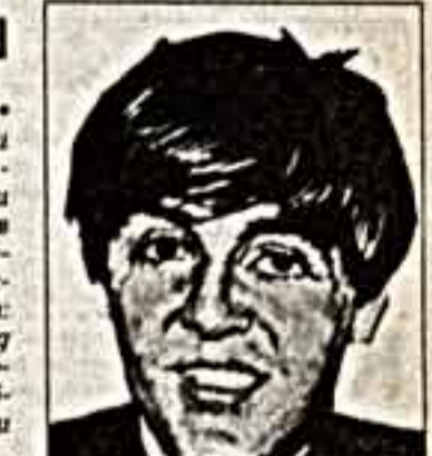
Пол Маккартни: мечта о пите

По сообщениям корреспондентов "Культуры" и ИТАР-ТАСС