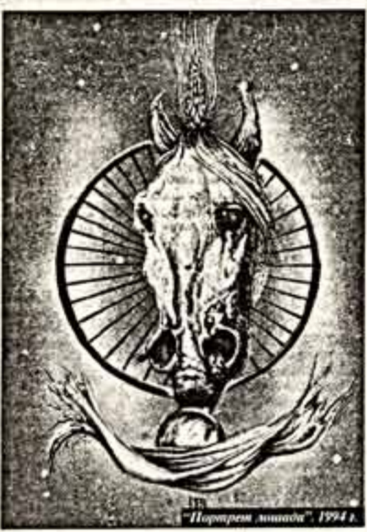
"Портрет Амира", 1994 г.