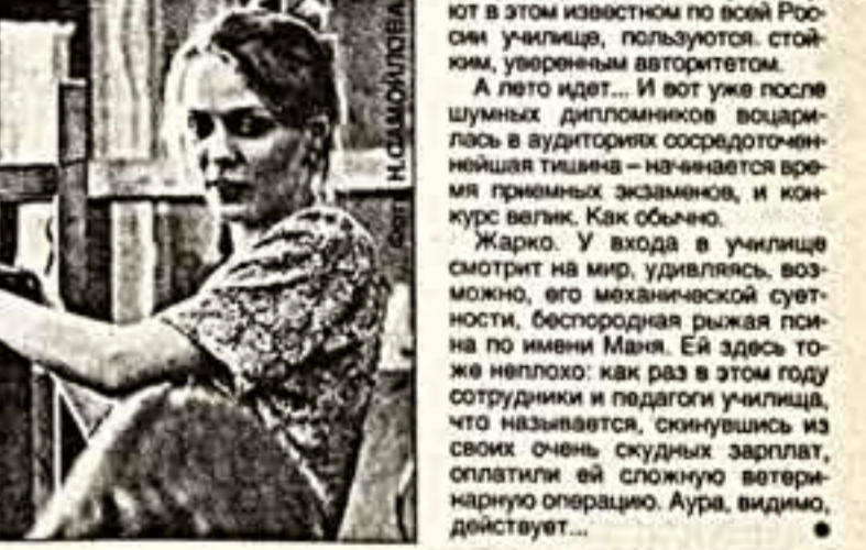
"Поларники и подполье сына"

Пожалуй, я не во всем согласен с ним. Вспомним картину Смолиных «На границе». Ведь и поныне в Таджикистане, ныне суверенной республике, служат российские солдаты. Они ежедневно рискуют жизнью, они погибают. Герои ли они? Безусловно. Но я не видел картин, запечатлевших их ратный труд. Художни-