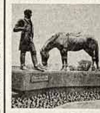
Памятник К. И. Батюшкову в Волгоде.

Памятник Константину Ивановичу Батюшкову открыт в Волгоде. Он установлен здесь — на родине великого русского поэта в честь 200-летия со дня его рождения. Памятник, воздвигнутый близ исторического ансамбля Волжского кремля, создан по проекту лауреата Государственной премии СССР скульптора В. Клыкова и архитектора В. Снегирева.