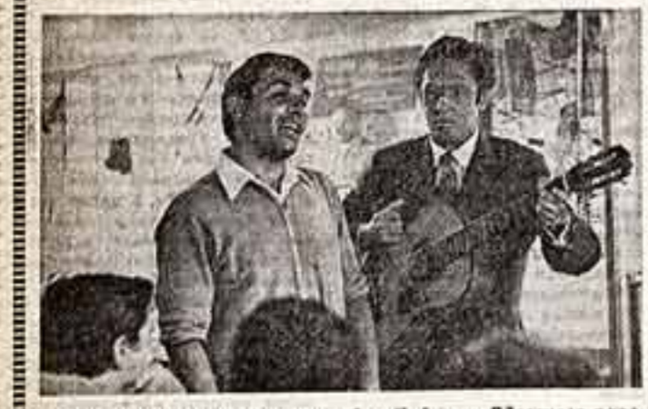
В красном уголке теплохода «Янг-Оль» Одесского пароходства здесь песни — здесь проходят концерты художественной самодеятельности артистов.