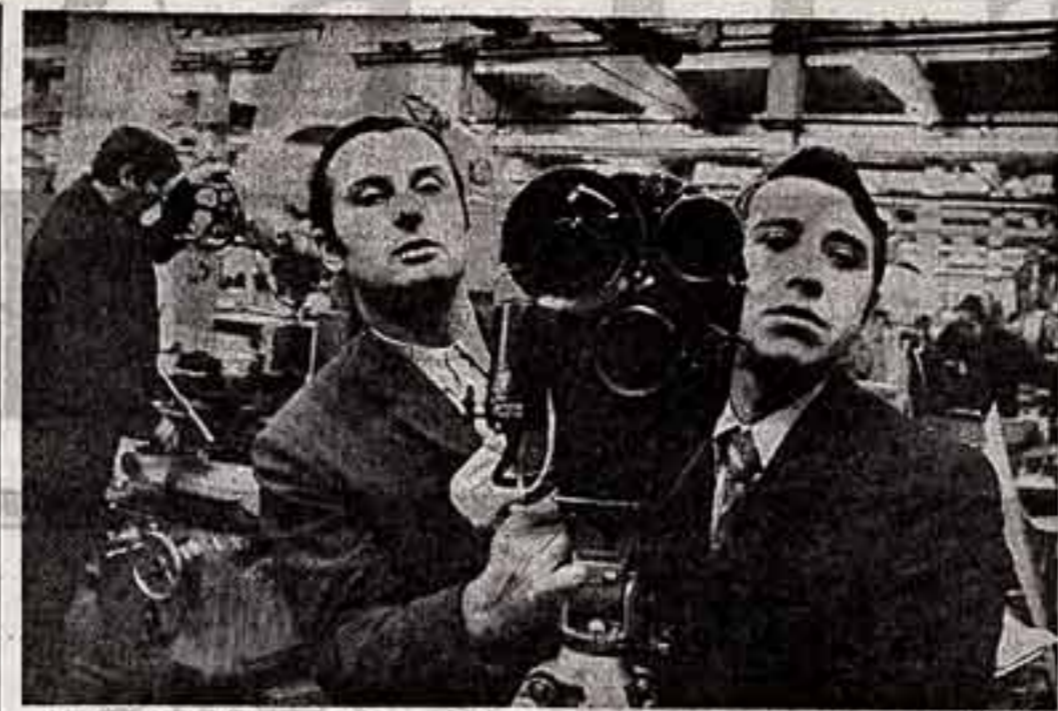
Тридцать семь фильмов о родном заводе тяжелого машиностроения в городе Жданове (Донецкая область) сняла народная киностудия «Искра». Их героями — те, кто своим трудом пишет славному историческому предпринятию, — ветераны производства, мастера «золотые руки», активисты-общественники, рабочие-спортсмены. Операторы студии (слева направо) — инженеры В. Страфун и В. Ткаченко на съемках одной из победителей соревнования.

Ленинское эстетическое наследие, о некоторых актуальных проблемах которого шла речь выше, вооружает нашу критику не готовыми ответами, не цитатами и рецептами, а прежде всего своей методологией идейно-эстетического всестороннего анализа.