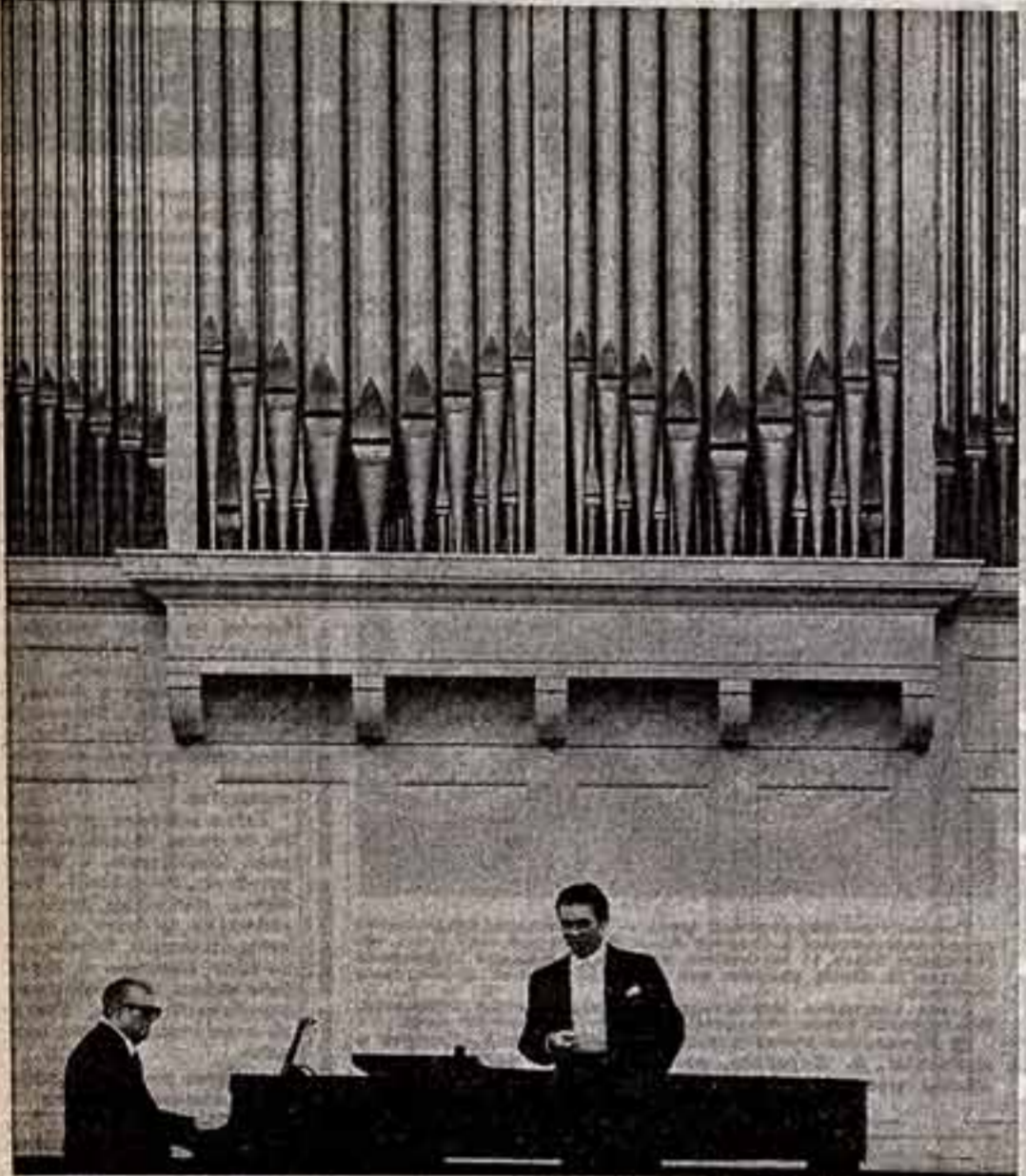
фотоконкурс Валерий ПЛОТНИКОВ.

И все-таки, говоря об этой картине, следует прежде всего сказать о чувствах уважения, которые рождает ее серьезность, ее сложность, ее бесспорная талантливость. В лучших местах ее язык поднимается до истинно поэтической образности, тяготеет к художественной символике. Как правило, актеру трудно «вписаться» в подобный образ — герой. Роль Насими играет молодой артист Расим Балаев, играет с достоинством трагедийную роль, органически соединяет со сложной метафоричностью кинематографа.