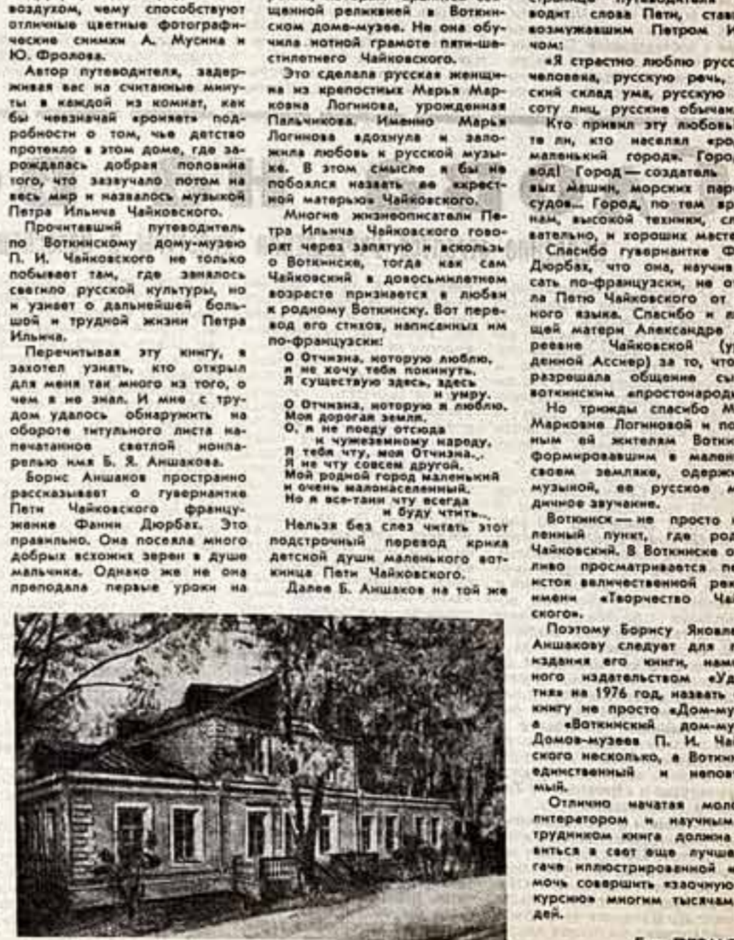
«Дом-музей П. И. Чайковского. Путеводитель». «Удмуртия», Ижевск, 1974.