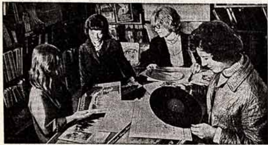
В оживленном центре болгарской столицы, на улице Вазова, расположен дом, который привлекает многочисленных посетителей. В этом доме находится книжный магазин, где продается советская книжная продукция. Здесь всегда у стендов и прилавков толпятся народники София с удовольствием покупают книги и грамзаписки издательств СССР.