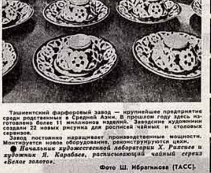
Ташментский фарфоровый завод — крупнейшее предприятие среди фарфоровых в Средней Азии...

В. Шиманский всегда ошарашивает на местном... «И вот пришел очередной директор...»