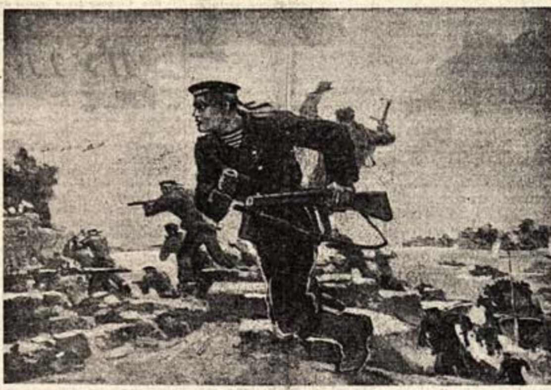
Десант. Картина Г. ИВАНОВА. На новелле работ советских художников.