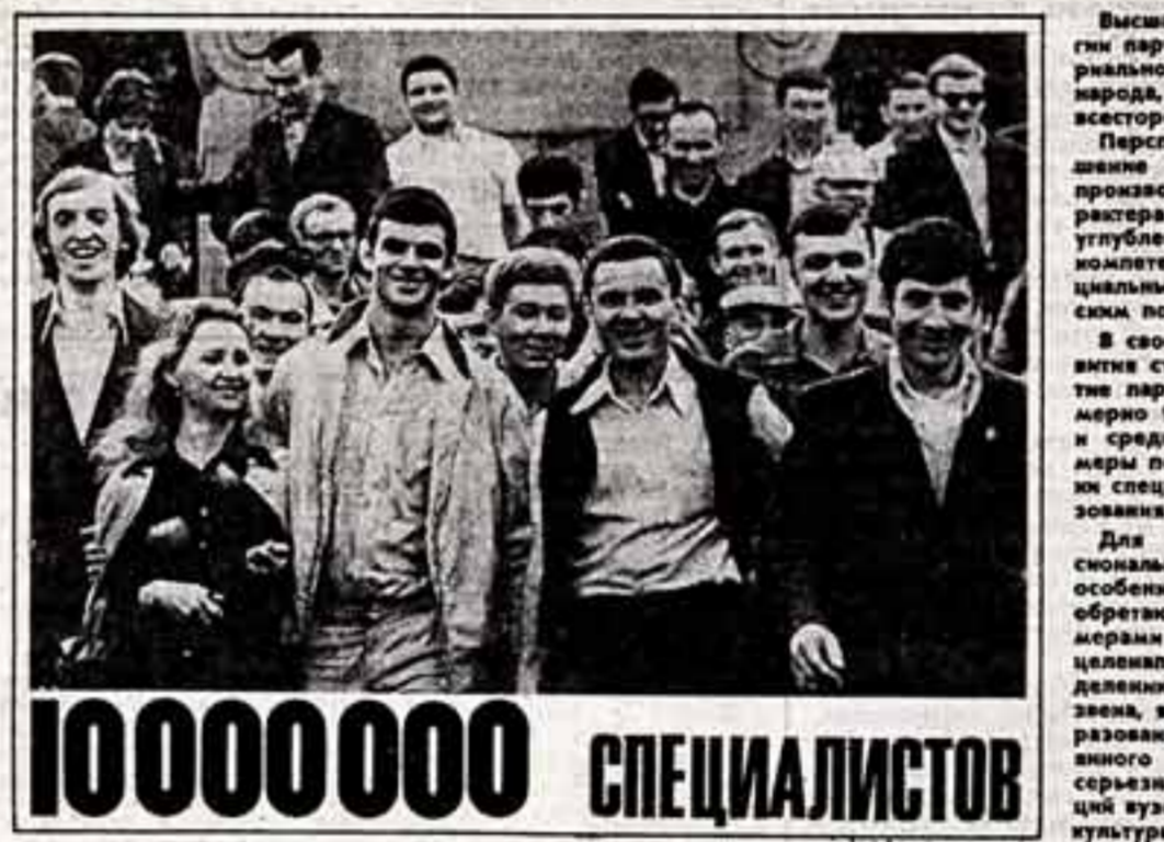
Высшая цель экономической стратегии партии — улучшение поднимать материального и культурного уровня жизни народа, создание лучших условий для всестороннего развития личности. Перспективы науки и техники, повышение эффективности общественного производства, усиление творческого характера труда требуют от специалистов углубления знаний, профессиональной компетентности, умения сочетать специальные знания с социально-политическим подходом к порученному делу. В своей программе социального развития страны на ближайшие десятилетия партия намечает подготовить примерно 10 млн. специалистов с высоким и средним образованием, осуществить меры по повышению качества подготовки специалистов и улучшению их использования в народном хозяйстве. Для нынешнего состояния профессиональных кадров в сфере культуры, особенно на селе, эти положения приобретают важнейшее значение. Всем мерам содействовать планомерно, целенаправленной подготовке и распределению кадров, повышению среднего звена, воспитывать в людях жажду знаний, ответственности, интеллигентности, обязательное повышение квалификации — серьезная задача партийной организации вузов и учащихся искусства, институты культуры, управления культуры.