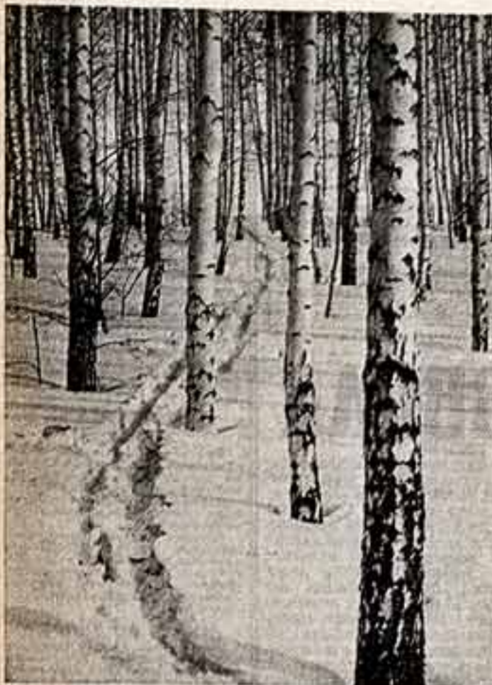
● В. СИНЦЫН. «Лес заповоенных». ● А. ФИЛДМОНОВ. «Мороз».