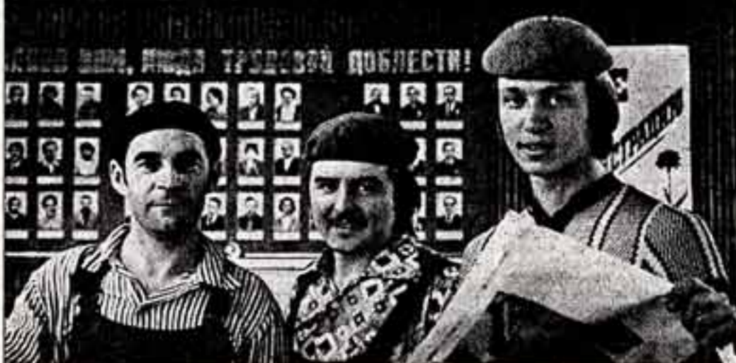
Перевыполнение плана — такой девиз рабочих Калининского полиграфкомбината. Работают в смену одиннадцатой пятилетки.