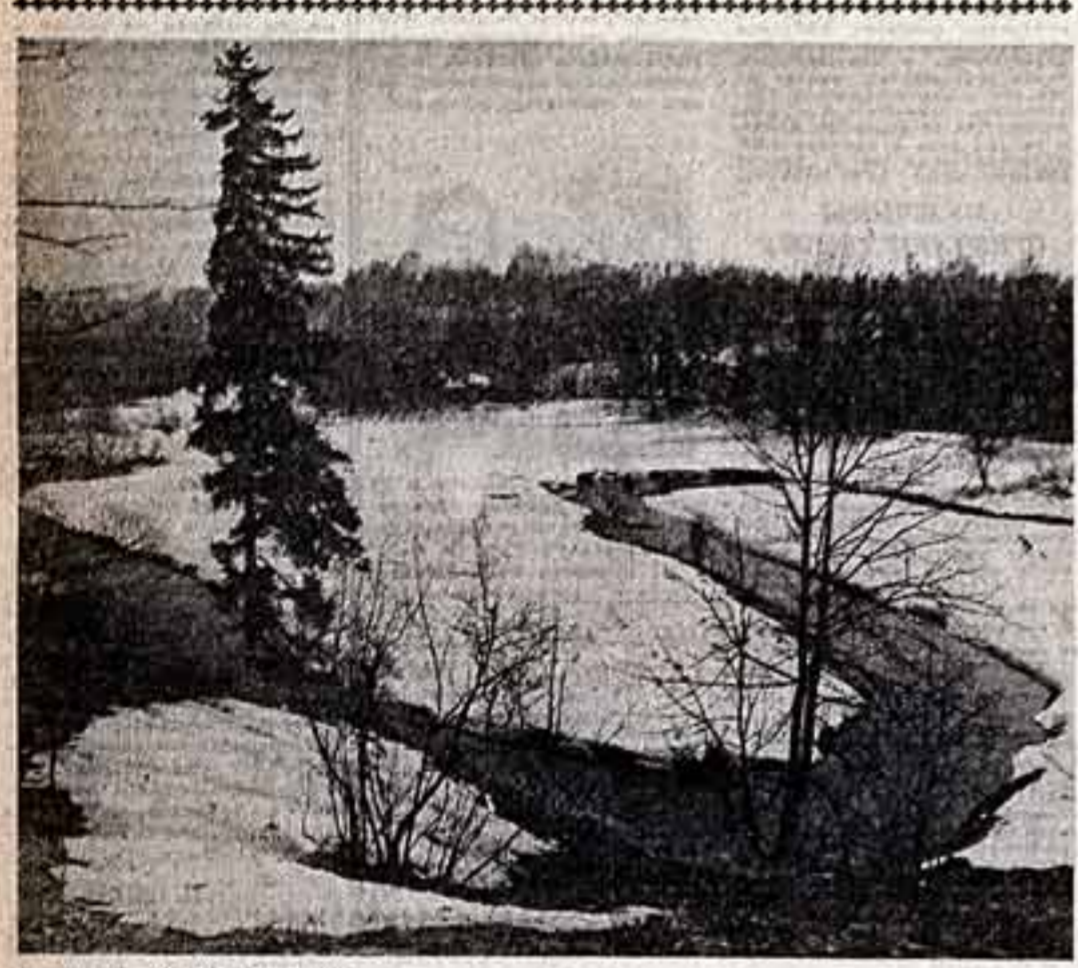
ФОТОКОНКУРС В. МАШАТНИ. «Дымят просторы».