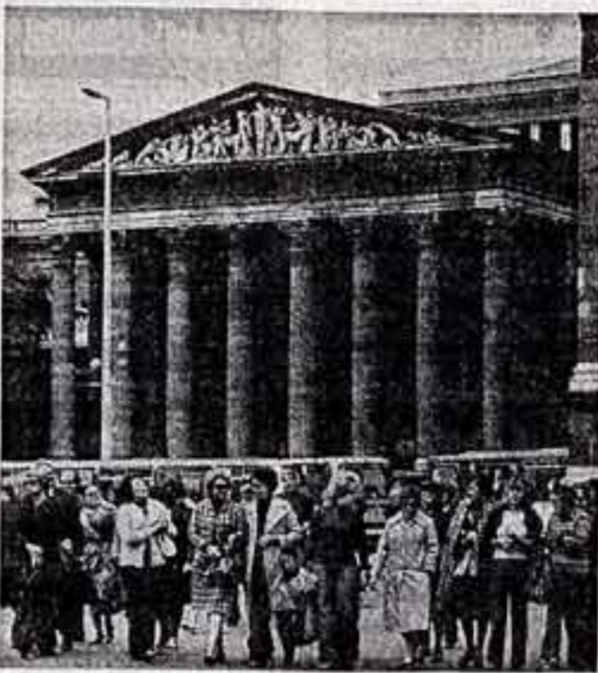
Советская высшая школа, создающая специалистов в области культуры и искусства, подготавливает тысячи венгерских специалистов. Созданные в народной Венгрии новая форма обучения позволила готовить и первых специалистов, получивших в дальнейшем дипломы и научные степени в вузах России, Ленинграда, Киева и других городов Советского Союза.

В период строительства социализма независимых стран, нас ждал олит, накопленный в ходе исторического развития первого в мире социалистического государства, основанного Лениным. Дружба венгерского и советского народов, сотрудничество между нашими странами углубляется и крепнет из года в год. На основе принципов интернационализма развиваются венгеро-советские экономические, политические и культурные связи. В кругах передовых венгерских представителей советская культура всегда имела большой авторитет. Сразу после освобождения в нашей стране возникла необходимость изучения и использования опыта советской культурной революции. Именно поэтому одновременно с проведением земельной реформы в Венгрии начались школьные преобразования, мобилизовавшие прогрессивную интеллигенцию страны и заложившие основы коммунистического воспитания подрастающего поколения. Уже тогда на венгерских языках была переведена книга М. И. Калинин «О коммунистическом воспитании. Павлики труды Маркса, Энгельса, Ленина по педагогике».