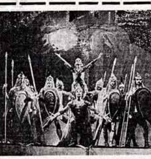
На сцене Саратовского государственного академического театра оперы и балета имени Н. Г. Чернышевского осуществлена постановка балет-оратории «Александр Невский» на музыку С. Прокофьева. Автор либретто Э. Варнинин, балетмейстер — заслуженный артист РСФСР А. Деметьев.