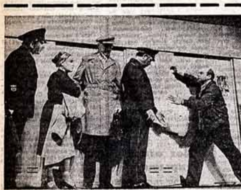
На сцене Московского Художественного академического театра Союз ССР имени М. Горького поставлен новый спектакль по пьесе А. Гельмана «Мя, иже...» Постановка и режиссура народного артиста СССР О. Ефремова и Е. Радомисльского, художник — заслуженный художник РСФСР В. Давеналь.