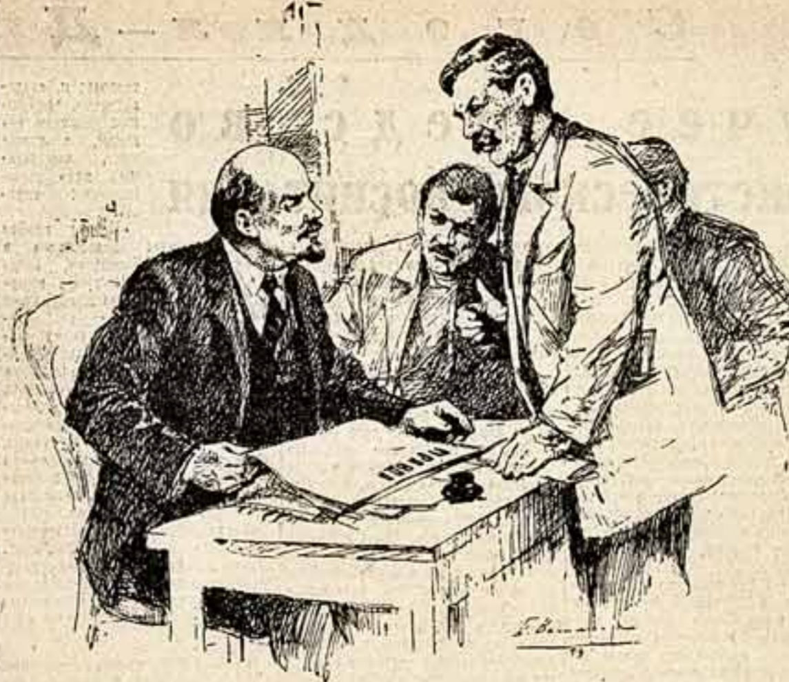
В. И. Ленин в редакции газеты «Правда» с рабочими корреспондентами (1917 г.). Рисунком заслуженного деятеля искусств РСФСР П. ВАСИЛЬЕВА.

Ленинские парки закладываются также и в других населенных пунктах Одесской области.