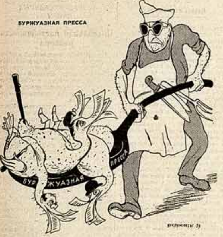
НЕSET ВСЯКУЮ ДИЧЬ. Рисунок КУРЬНИНСКИХ.

Критик также отмечает исполнение Кашан танца с княжком из балета «Красный петух» и пишет, что «станционные почти все время находились в воздухе». Танец «Весенние воды» в исполнении Л. Богомоловой и