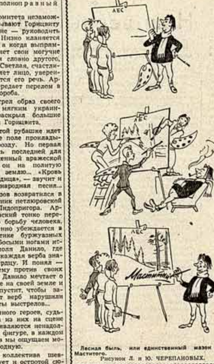
Лесная быль, или единственный наездник Маститого. Рисунки Л. и Ю. ЧЕРПАНОВЫХ.