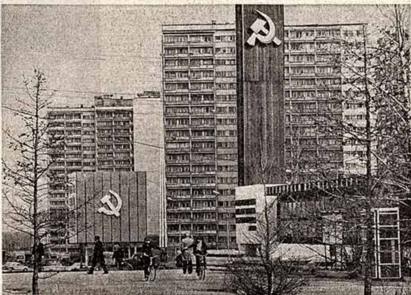
Москва предпраздничная. На одной из улиц Кузнецкого района.

Искусство не может пытаться опытом вчерашнего дня, сколь бы значительна он ни был, — ему нужен собственный, живой, деятельно обогащаемый жизнью опыт. Подлинная как высшую ценность то новое, передовое, коммунистическое, что составляет сущность нашей советской жизни, — в этом и творческая сила художника, и начало начал большой красоты и мудрости искусства. Той красоты и мудрости, когда образы прекрасные и одухотворенные знанием жизни народа — художественное слово, переливы красок, выразительность камня, гармония звуков — вдохновляют современников и передают потомкам память сердца и души о нашем поколении, о нашем времени, о его великих свершениях.