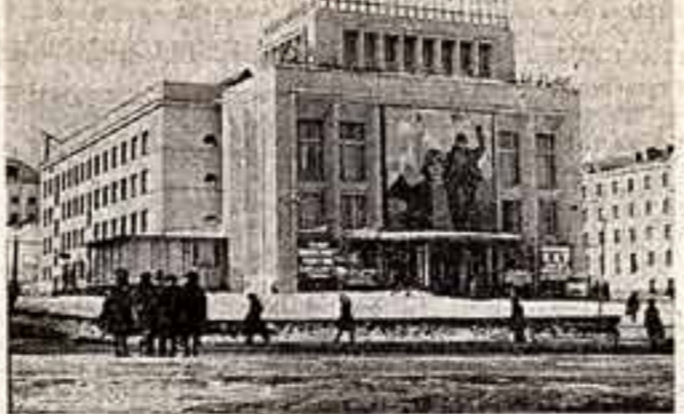
Дворец культуры горно-металлургического комбината имени Завенягина.

В праздничном убранстве Дворца культуры Норильского горно-металлургического комбината имени Завенягина. Участники дадут коллективный художественный самодеятельности готовя в эти дни новые программы.