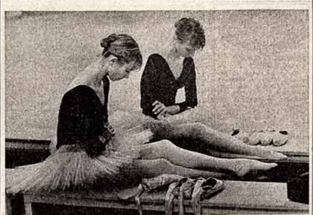
фотоконкурс А. МАКАРОВ. «Балерина». С. КОСТРОМИН. «Начало сезона».