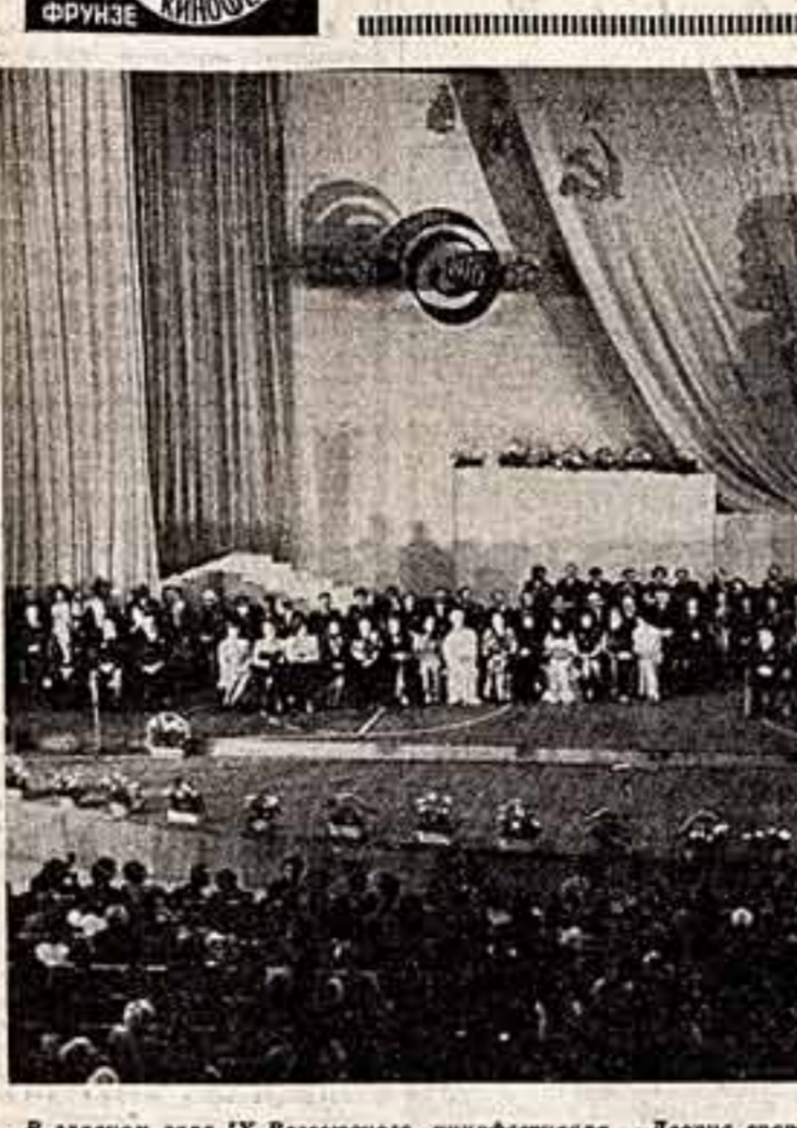
В главном зале IX Всесоюзного кинофестиваля — Дворце спорта столицы Киргизии.

Стремительно мчится фестивальное время. В калейдоскопе фильмов, встреч, событий оно становится необычайно емким. Всего одна неделя, но сколько открытий, сколько впечатлений!