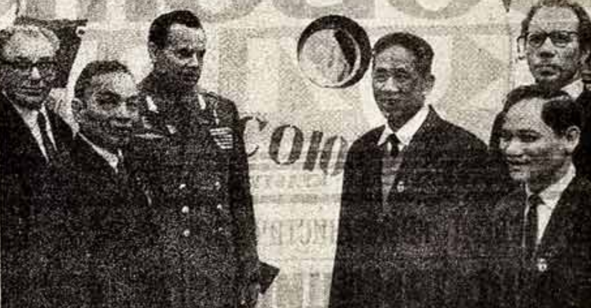
XXIV съезд КПСС. Члены делегации Партии трудящихся Вьетнама посетили Звездный городок. На снимке: у маллета космического корабля «Союз».

XXIV съезд КПСС, сказал заместитель Председателя Совета Министров РСФСР, председатель Госплана Российской Федерации тов. К. М. Герасимов, займет особое место в истории нашей Родины. Оратор охарактеризовал достижения трудящихся РСФСР в соревнованиях