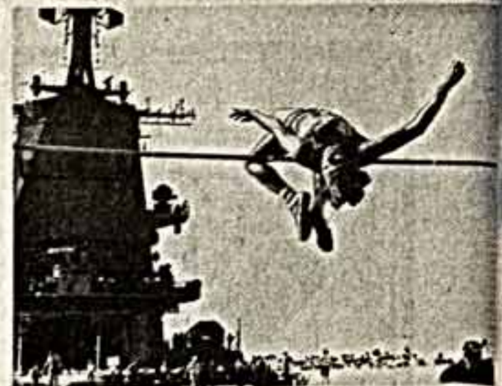
Вот это да!