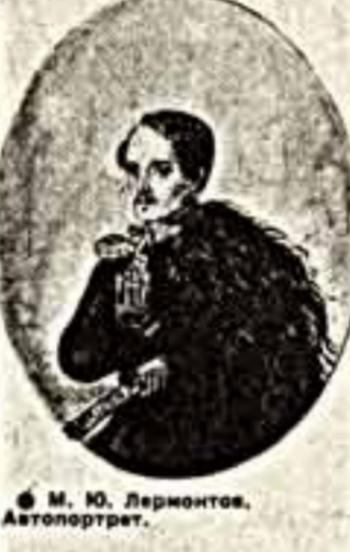
М. Ю. Лермонтов. Автопортрет.