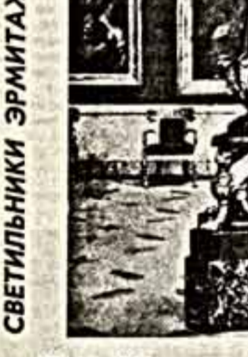
Светильники Эримтажа — это особый мир. Без него никак не выгляди бы ни тан торжественно и величественно...

фильм «Светильники Эримтажа» открывает тайны этого мира.