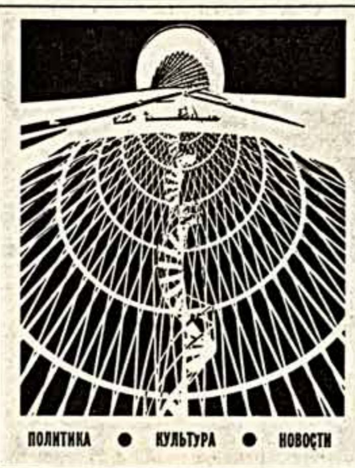
ПОЛИТИКА • КУЛЬТУРА • НОВОСТИ