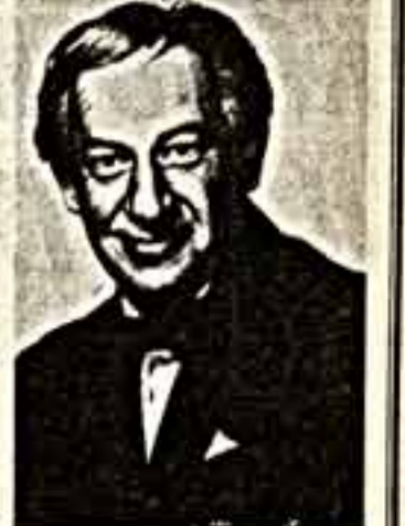
— Рос. канал, 13.15.