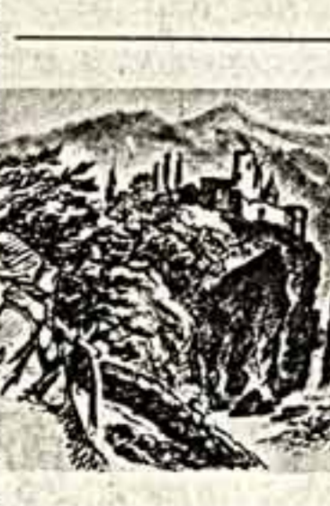
Развалины на берегу Арагвы в Грузии.

Вопрос о секундантах было четверо, но участие в поединке князя С. Трубецкого и близкого друга поэта А. Столыпина-Монго от суда утаили. Как и поэт, они были в опале у Николая I. Пять союзников дуэля дали, как утверждал впоследствии Васильчиков, «друг другу слово молчать и не говорить никому ничего другого, кроме того, что... показано не формальным следствием. Из этих слов князь вывел, что тайно было бы считать за истину материалы судебного дела.