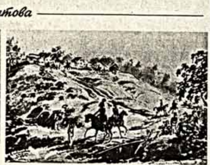
Эпизод из маневров в Красном Селе.

Итак, если наша догадка верна, проясняется многое в до сих пор загадочных и полуживых воспоминаниях и воспоминаниях участников этой трагедии. «Роман «Герой нашего времени» появился за год до гибели Лермонтова, но несомненно представляется, будто речь в нем идет о событиях градуэтной дуэли. Если сам автор незримо присутствует в образе Печорина, то он не случайно наделил образ Грушницкого некоторыми чертами характера и внешности Мартынова. Современники поэта не без оснований полагали, что Мартынов унаследовал от своего отца, это якобы сыграло свою роль не только в ссоре с поэтом, но и риском предположить, во время самой дуэли. Ведь это именно к нему, Мартынову, были обращены слова из дневника Печорина: «...Я решился предоставить все участь Грушницкому; я хотел испытать его; я душе его хотел протиснуться искра вольнодумия, и тогда все устроилось бы к лучшему; но самолюбие и слабость характера должны были торжествовать...»