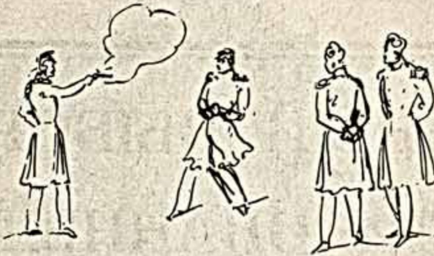
Дуэль. Рисунок М. Ю. Лермонтова.