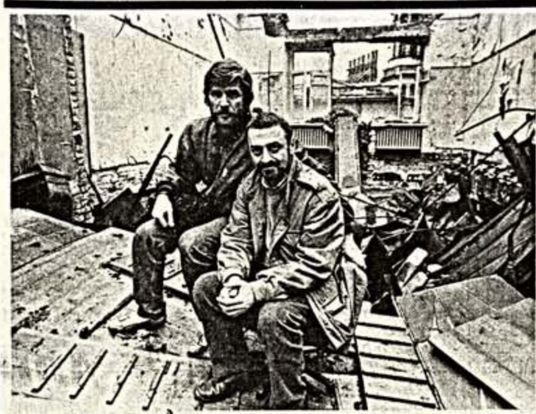
«Любовь и родному пепелищу»... Произвольное, восполное гением чувство, — так та же любовь, та же любовь и руины и дальше будет обращаться к культурным памятникам Отечества...

А что будет в сфере культуры? На этот вопрос ответил председатель Комитета Верховного Совета ТССР по науке, народному образованию, культуре и воспитанию народная артистка СССР Маз-Гозель Аймедова.