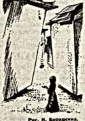
Рис. И. Бородин.

М. Чернышов, Москва: — В последнее время мы наблюдаем значительный рост преступности в стране. Этому не в малой степени способствует снижение культурного уровня населения: посещение библиотек, театров, музеев. Низкая культура и высокая преступность идут рядом. Ведь не случайно в Москве, где культурный уровень населения выше (по стране), ниже преступность. Поэтому экономия на культуре (три копейки в день на человека), мы вплотную подвергнем опасности жизнь наших граждан. По-моему, с этим мириться нельзя!