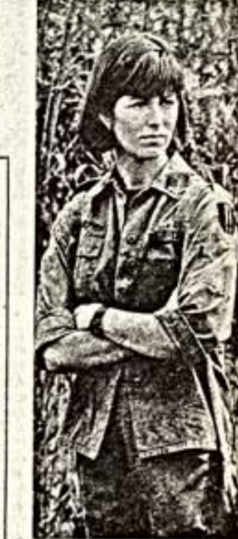
Коллин Макмерфи в фильме «Китайский пляж».