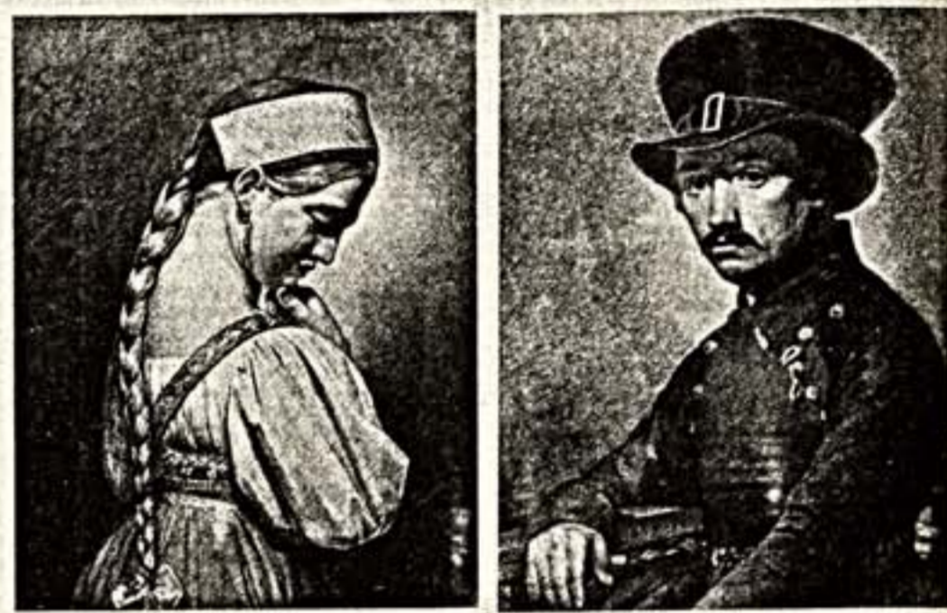
«Неугасимая лампада» — так называется выставка, открывшая в залах Всесоюзного киноцентра. В экспозиции — произведения Василия Дмитриевича Поленова из музея-усадьбы на Оне, иконы, богослужебные сосуды, гриммы и другие предметы быта Псковско-Пензенского монастыря, фотографии В. Корнилова и И. Сироты. Дары от выставки поступят на благотворительные цели — инвалидам, мало-