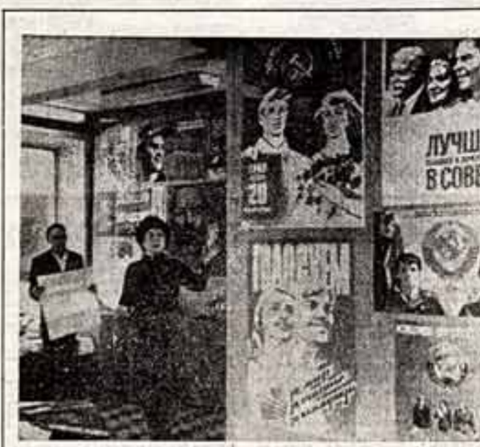
С первых дней предвыборной кампании на постоянной действующей выставке наглядной агитации г. Жданова Донецкой области поступили плакаты, альбомы, другие материалы, посвященные выборам в местные Советы депутатов трудящихся. В залах выставки.

Следует напомнить тем, кто делает первые шаги в кино, о той мере высокой ответственности, которую возлагает на них наше время великих свершений. Сознание своего гражданского и профессионального долга — вот та самая «честь смолоду», которую следует беречь каждому дебютанту, ибо ему предстоит решать благодарную задачу воспитания нового человека. И мы вправе требовать от каждого кинохудожника без скидок на молодость яркого и полнокровного отражения на экране больших идей и мыслей, создания образа нашего современника, который стал бы властителем дум молодежи, ее вожаком и спутником на жизненных дорогах.