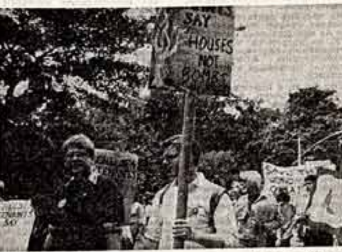
Митинг в Нью-Йорке против войны. На фото — выступление Рейгана. Он говорил о возможности ведения «ограниченной» ядерной войны. Я подумал: это же безумие. А потом мне пришла в голову мысль: а не безумие ли я, если скажу слова в то время, как под предлогом советской угрозы разрабатываются самые безумные планы.

Ничего подобного Америка еще не видела за всю свою историю. Их был миллион. Белых и негров, директоров корпораций и безработных, актеров, поэтов, врачей, домохозяек, священников, адвокатов, пожаров, — политиков — представителей практически всех слоев американского общества. Они говорили с акцентом новой Англии и Западной Среднего Запада и Нью-Йорка, глгобокого Юга и Техаса. И все они говорили одно: мы хотим мира.