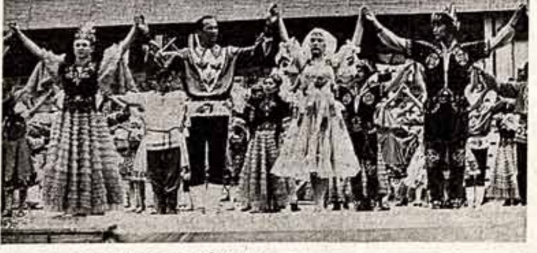
Фрагмент праздника песни, танца и спорта на Медое.