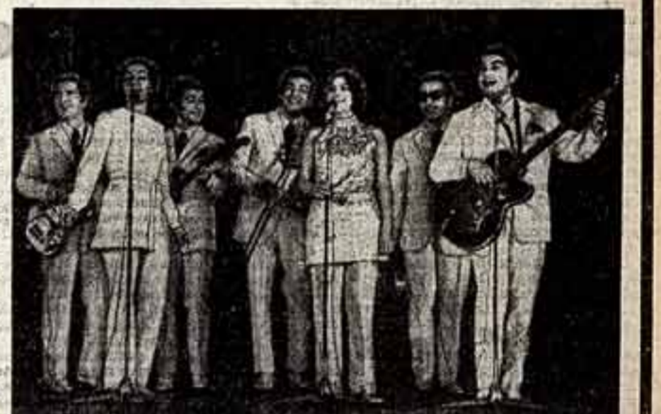
Исполняется по-прежнему народная песня «Ивения».