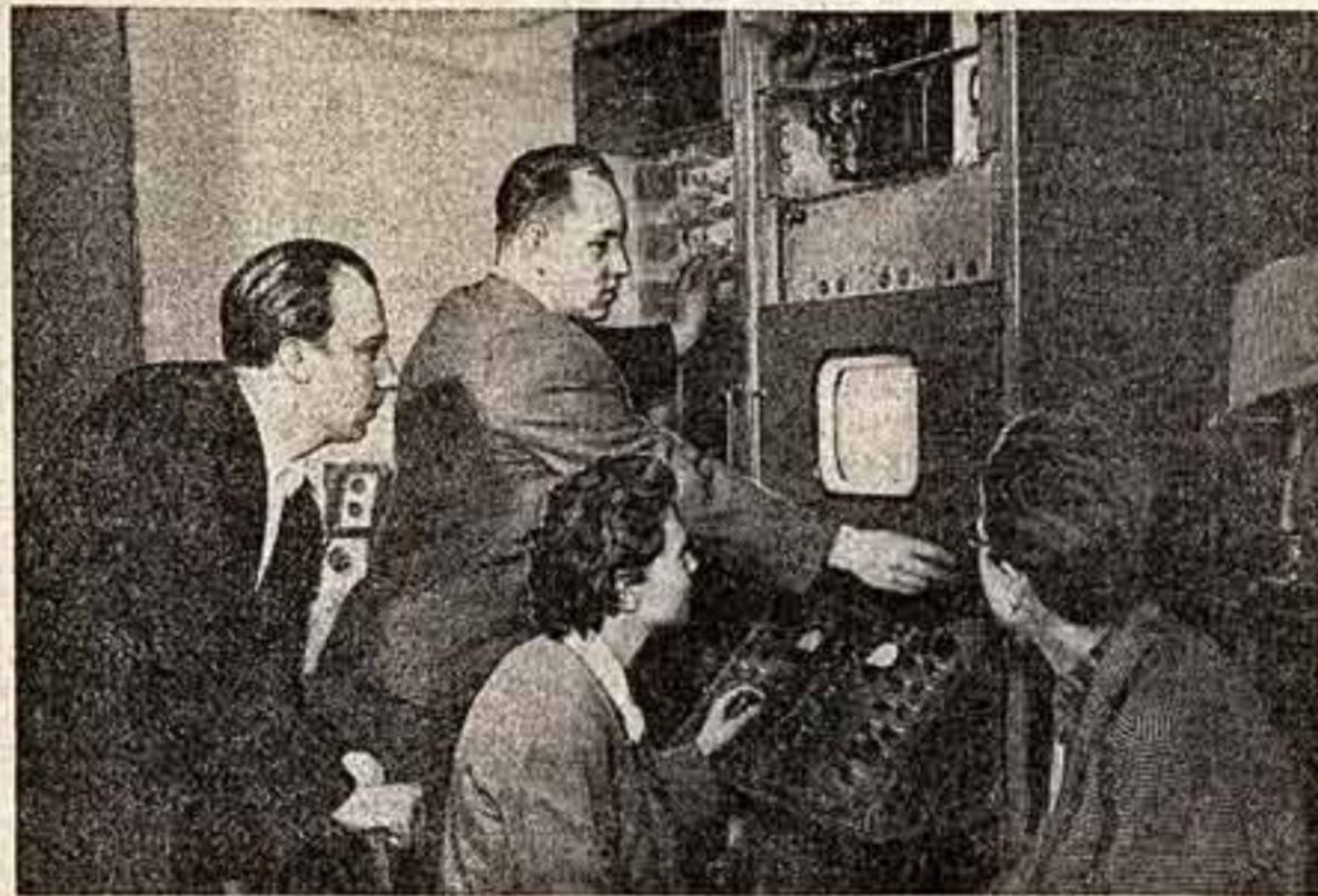
Аппаратура цветного телевидения прошла испытания

Москва. Комплекс аппаратуры для цветного телевидения создан и изготовлен коллективом инженеров и техников Научно-исследовательского института Министерства связи СССР. Летом текущего года тысячи посетителей Выставки достижений народного хозяйства СССР уже смогут увидеть первые пробные передачи цветного телевидения. Аппаратура предварительно прошла испытание в экспериментальной студии цветного телевидения, а на выставке с ее работой могут ознакомиться москвичи и многочисленные гости столицы.