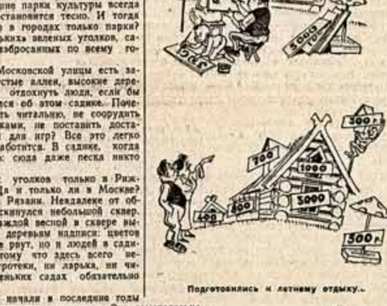
Подготовились к летнему отдыху.

Помимо этого, в ряде городов и поселков организованы клубы, где можно познакомиться с новыми фильмами, почитать журналы, пообщаться с интересными людьми.