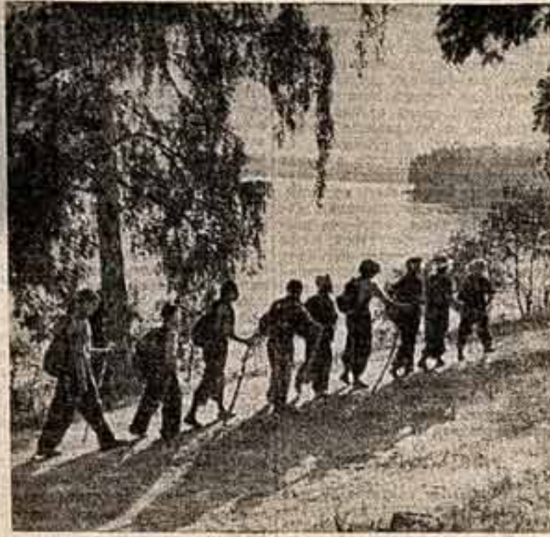
Туристы в походе.

Начался летний туристский сезон. В него принесет он любителям путешествий? С этим вопросом наш корреспондент обратился к начальнику Центрального туристско-экскурсионного управления ВЦСПС В. Орфинскому.