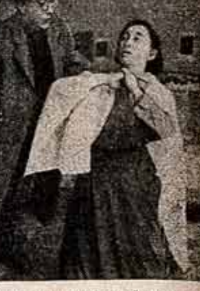
Китайский экспериментальный драматический театр репертуар «Гроу» А. Н. Островского.

В Пекине есть еще одна «улица культуры»: это Люцзинь, а в магазинах Хэиньинь. На этой улице масса старинных антикварных магазинов, где продаются картины, кувалды и бумажки, национальные музыкальные инструменты. Многие букинистические магазины. На этой улице тоже часто бывают иностранные гости.