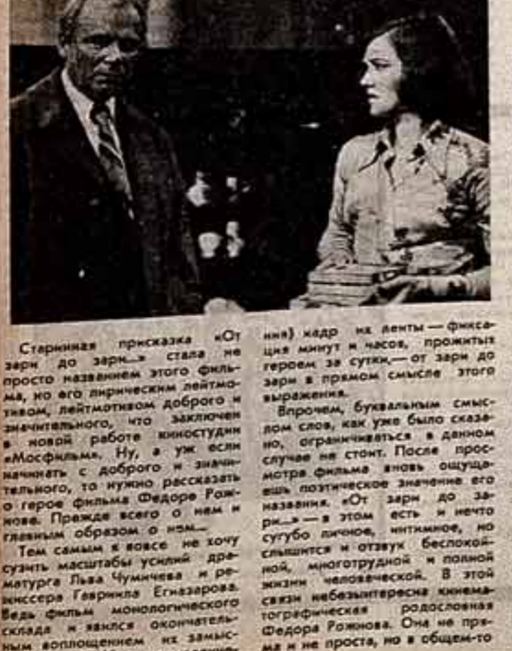
Старинная присказка «От зари до зари» стала не просто названием этого фильма...