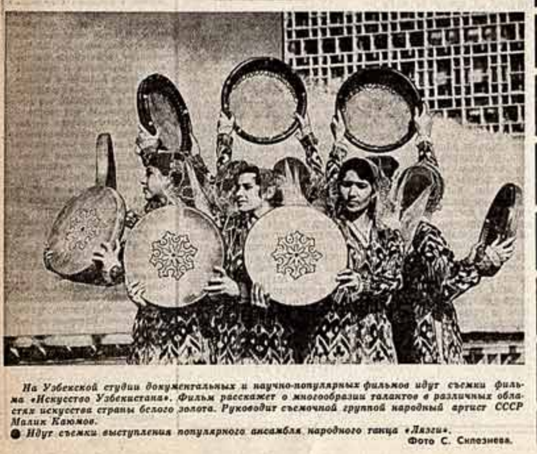
На Убелеской студии документальных и научно-популярных фильмов идет съемка фильма «Искусство Узбекистана». Фильм рассказывает о многообразии талантов в различных областях искусства страны белого золота. Руководит съемочной группой народный артист СССР Малик Каюмов.