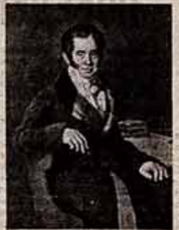
Его звали Карлом Росси, и в его жизни текла итальянская кровь. Фамилия Росси связана с итальянским словом «росса» — «ирисский». Но мне хочется понять эту фамилию — Росси — не этимологически, а по созвучию с нашими словами «россиян», «россиянин»; потомок италийцев стал великим российским зодчим.

Современный советский балет — вид сценического искусства, где успех в целом решается отношением всех его участников к музыке; ее изучением, ее пониманием, про-