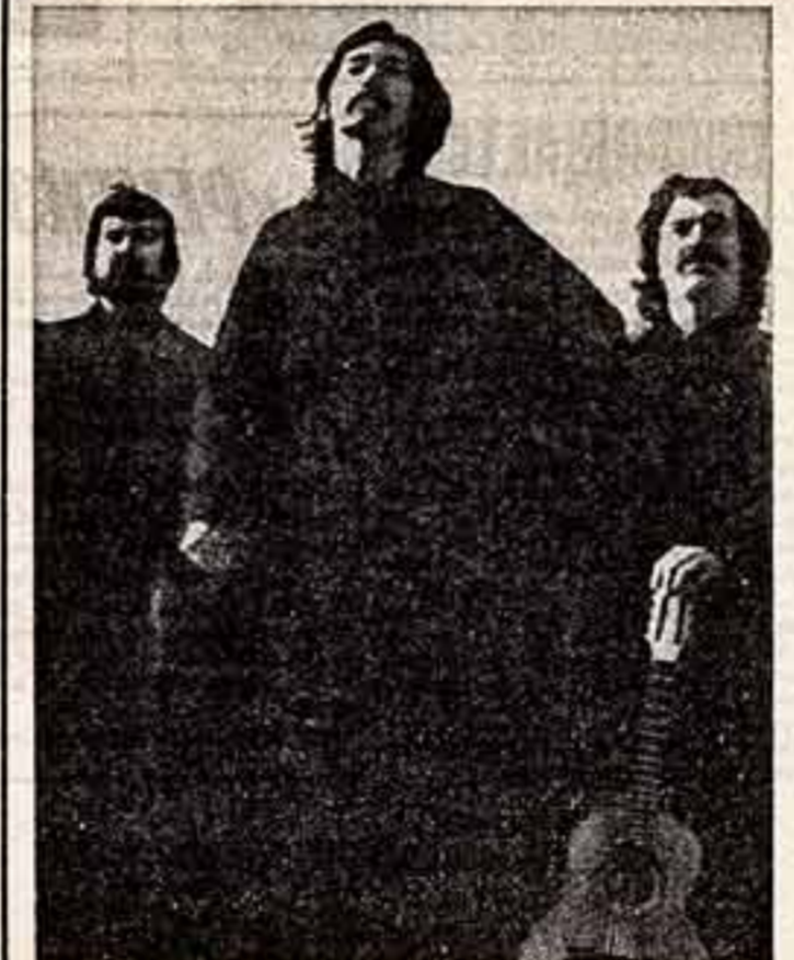
Участники ансамбля «Килапаюн».