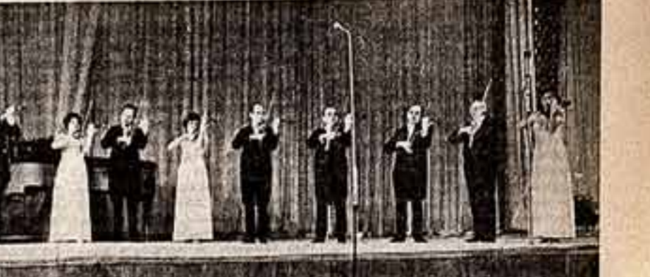
Создателем и бесценным художественным руководителем коллектива является заслуженный деятель искусств...