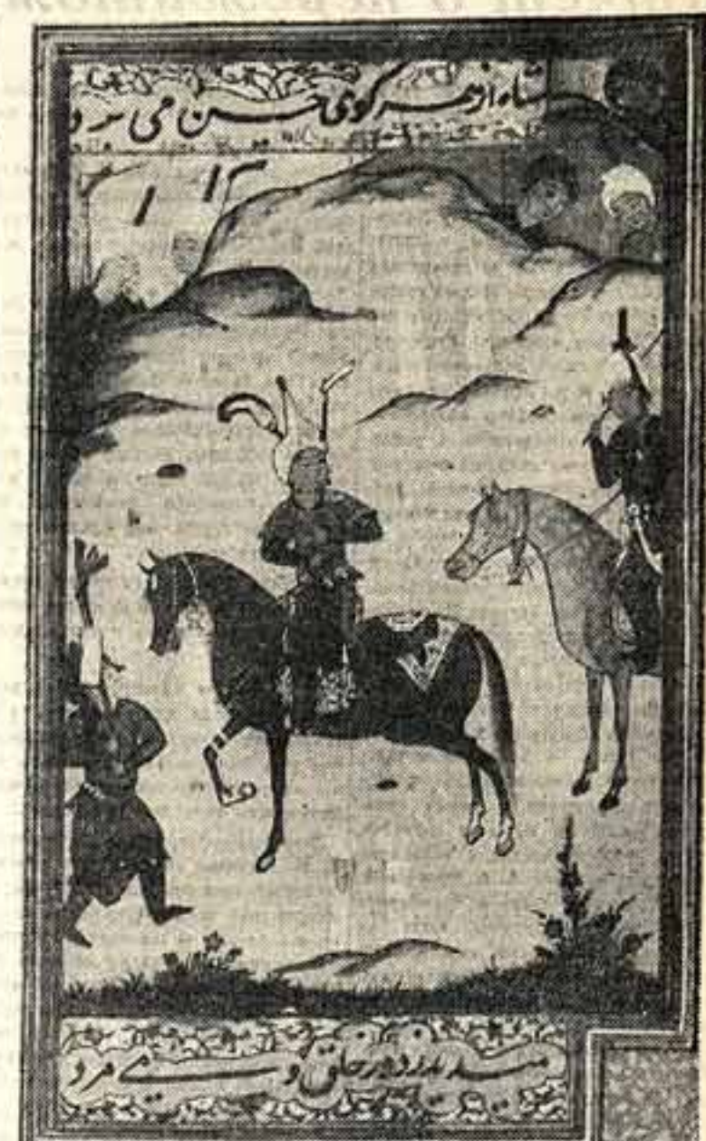
Тифлисский музей отправил на выставку иранского искусства ценнейший манускрипт «Шах-наме». На фото: одна из миниатюр этого манускрипта

Особое значение приобретает ленинградский конгресс в связи с тем, что в нем участвуют представители иранского правительства и широкой общественности, выпускающей специальную литературу советскими издательствами, и прочие мероприятия, сообщения о которых приводятся ежедневно на страницах печати.