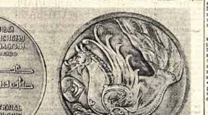
III международному конгрессу по иранскому искусству и археологии выпускается для членов конгресса специальная медаль. На лицевой стороне медаль изображена фантастическая собака-птица (самурб), упоминаемая в древних источниках как тинист, как родоначальница и покровительница всех животных и растений. Образ этой сказочной птицы впервые в иранской иконографии в фойерборгском виде европейских народов. Интересно, что эта птица до сих пор бытует в украинском народном песне.

Создание музея привело к постановлению пленума конгресса о необходимости содействия международного конгресса в Ленинграде на базе Эрмитажа.