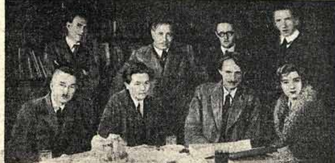
Анри Барбюс среди работников Государственного Камерного театра 1932 год.

Результаты Февральской революции, т. е. простое падение самодержавия, означают великую победу, достигнутую вех востановления неслышавшего. Они показывают на всю жизнь самодержавия, летящую вправо, на трон, похотенный взором поэта, на мусорную кучу старого режима и говорят: «Долово, Хватить!» Но слова пролетариата звучат громом востановления неслышавшего. Они показывают на всю жизнь самодержавия, летящую вправо, на трон, похотенный взором поэта, на мусорную кучу старого режима и говорят: «Долово, Хватить!» Но слова пролетариата звучат громом востановления неслышавшего.