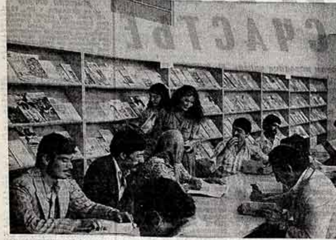
Советский и африканский народы отметили встречу в рамках заключенного Договора о дружбе, добрососедстве и сотрудничестве между СССР и ДРА.