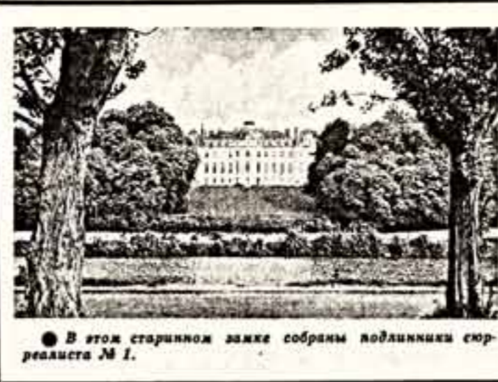
В этой старинной шапке собраны подлинники сурреалиста М. Л.