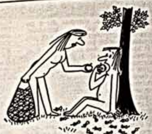
Рисунки В. Владова, М. Вайсборда, А. Белько, М. Оффенгагена, С. Ашмарина, И. Челмодеева.