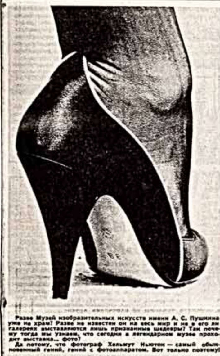
Разве Музей изобразительных искусств имени А. С. Пушкина умеет не красть? Разве не известны он на весь мир и не в его ли галереях выставляются лишь признанные шедевры?

его значительность и человечность. Но очень жаль, что для большинства зрителей с ним до сих пор осталась заочная встреча, так как в Музее изобразительных искусств имени Пушкина попали единцы.