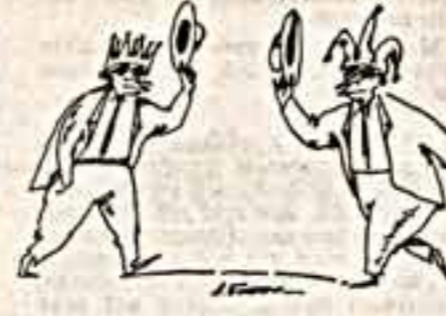
КАРИКАТУРЫ С НАТУРЫ