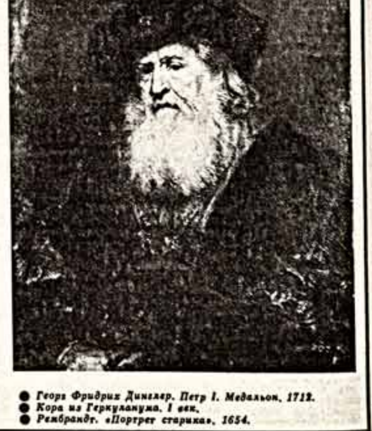
Георг Фридрих Гегель. Петр I. Медальон, 1712. Кора из Геркуланума. I век. Рембрандт. «Портрет старика», 1654.

ним. В Белом зале вы найдете экспонаты пяти из них. Прежде всего это полотна голландских мастеров Рембрандта, Ван Дейна и известных итальянских художников эпохи позднего Возрождения П. Веронезе, Я. Бассано и Д. Досси. В центре зала посетители встретят поразительно своим линиями античные скульптуры, образцы французской бронзовой скульптуры XVIII века, самая богатая в мире коллекция которой находится в Дрездене. Гости выставки будут, несомненно, интересно увидеть первый бронзовый бюст, созданный еще в 1498 году, Фридриха Мудрого, мецената и просвещенного властителя, «открывшего» Дрезден и покровительствовавшего ему. Кстати, именно он пригласил Л. Кранхаха, чьи картины здесь представлены, в Виттенберг. И, наконец, венчают экспозицию в этом зале экспонаты всемирно известной сокровищницы декоративно-прикладного искусства Дрездена «Зеленого свода». Все эти произведения неповторимы в своем исполнении. Здесь центральное место занимает золотой, украшенный большим сапфиром ковш Ивона Грозного. У вас наверняка