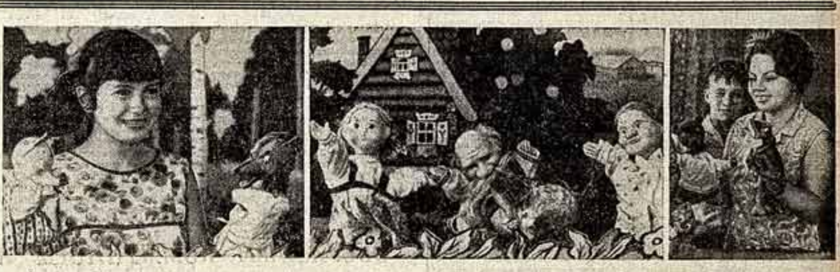
В колхозе «Большевик» Гусь-Хрустального района Владимирской области есть своеобразный детский клубный театр. Ребята сами делают кукол, шьют им костюмы, изготавливают декорации. Своем спектакле театр показывает в детских садах и школах района, на полях станях колхозных бригад.

в 1970 году коллективом узбекской студии «Телефильм» подготовлено несколько документальных лент — «Белое золото» и «Кари-Якубы» (режиссер Х. Ибрагимов), «Павильон Бухары» и «Сказки бабушки Хазир» (режиссер А. Касимов) и другие.