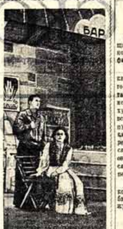
Самодельный коллектив клуба новоборских железнодорожников поставил оперетту И. Дунаевского «Волны восточного востра». Новая постановка пользуется большим успехом у зрителей.

Сельские кинорейтеры остро ощущают, что наша кинорожничья индустрия еще мало цветных фильмов. Это расширяет возможности кинематографии в области цветного кино. Это расширяет возможности кинематографии в области цветного кино.