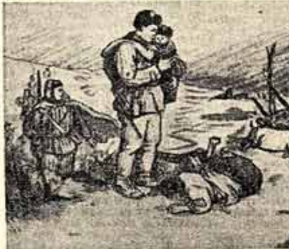
Портретом, воспевающим героическую борьбу корейского народа и китайских добровольцев...