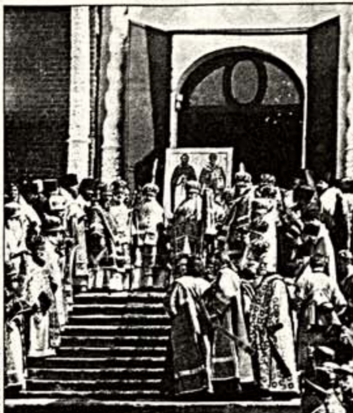
Слева направо: икона св. Кирилла и Мефодия. Торжественный молебен на крыльце Успенского собора. В Рязанском кремле

Радушно и доброжелательно встретили Рязань День славянской письменности и культуры.