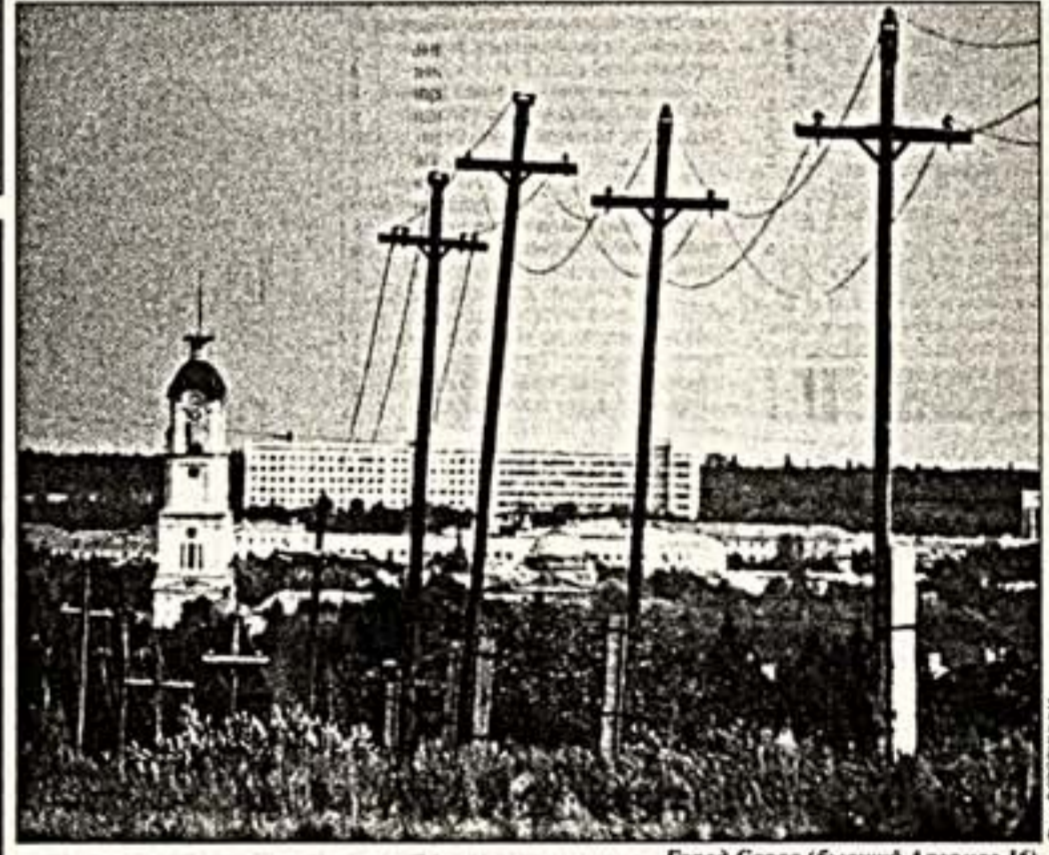
Город Саров (бывший Армавир-16)