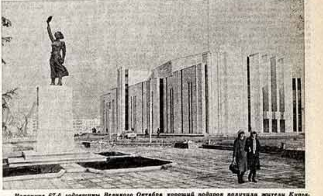
Назавлуне 67-б годовщеним Великого Октября хороший подарок получили жители Кураля — здесь оторки концертный зал областной филармонии. В ярмарочном дворце два зала — на 1.000 и 200 мест. На сцене могут выступать большие оркестры, хоры и танцевальные коллективы. ● Новый концертный зал.

С 12 по 18 ноября в Казахстане будет проходить Всесоюзный фестиваль советской музыки. В эти же дни в Алматы состоится выходящий пленум правления Союза композиторов СССР. Его тема — «Гражданственность и патриотизм в творчестве советских композиторов». Участники пленума обсудят деятельность многонационального отряда мастеров музыкальной культуры в свете задач, поставленных в речи Генерального секретаря ЦК КПСС, Председателя Президиума Верховного Совета СССР К. У. Черненко на ноябрьском пленуме правления Союза писателей СССР. Пленуму правления Союза композиторов СССР была по-