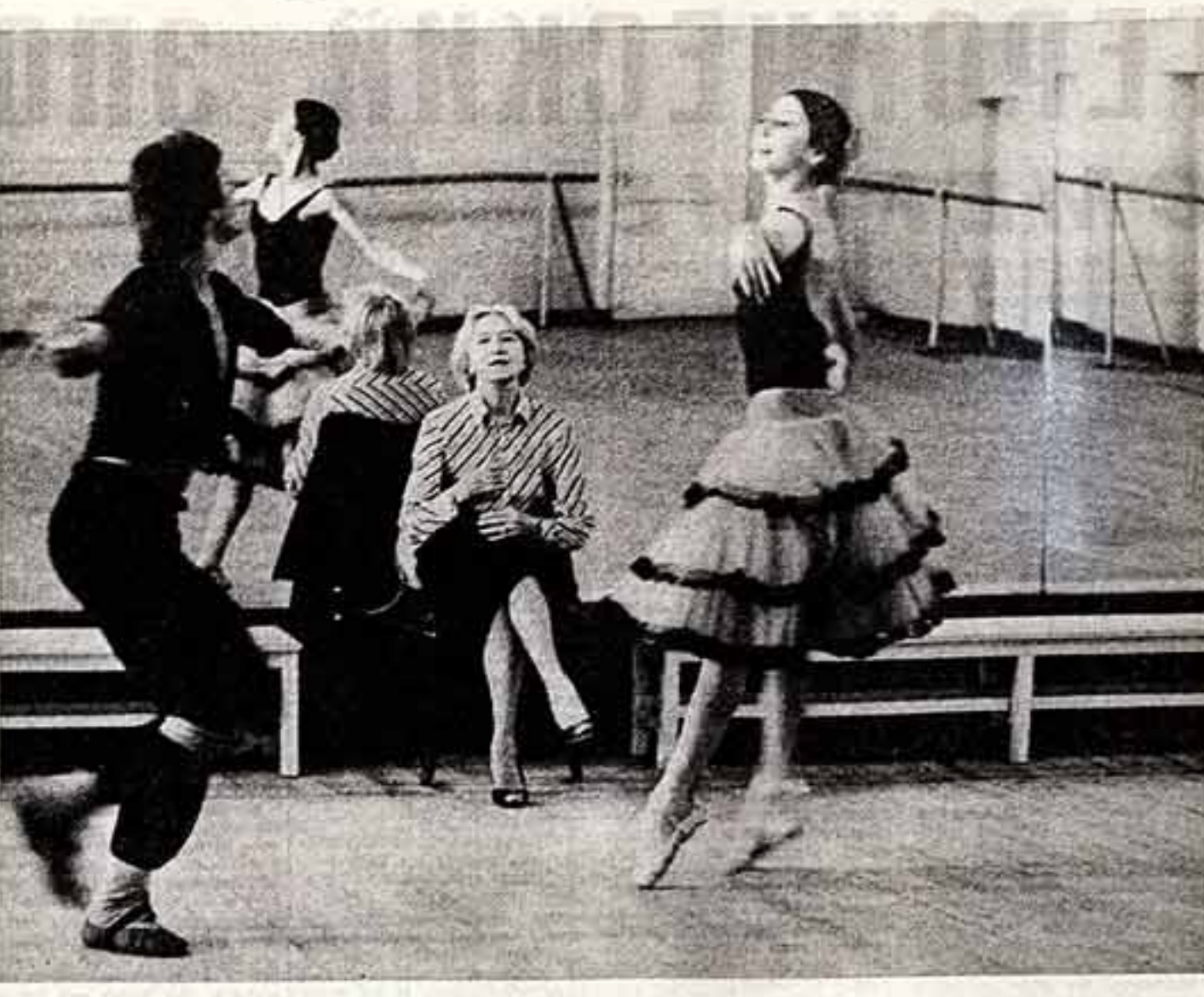
ФОТОКОНКУРС «Уроки Галики Удальковой».

Г. АШИН, доктор философских наук, профессор.