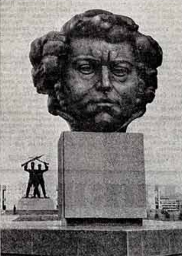
В начале года армянский скульптор С. Багдасарян был удостоен звания народного художника Армении, а осенью, когда страна торжественно отмечала 150-летие вхождения Армении в состав России, в республике почти одновременно открылись два созданных им монументальных памятника.

Другое творение скульптора — мемориальный комплекс в новом промышленном центре республики — городе Абовян. Фото В. Немрута (ТАСС). В начале года армянский скульптор С. Багдасарян был удостоен звания народного художника Армении, а осенью, когда страна торжественно отмечала 150-летие вхождения Армении в состав России, в республике почти одновременно открылись два созданных им монументальных памятника. Первый установлен у подножия древней горы Хуступ, в центре живописного горничного города Кафан. Монумент посвящен прославленному армянскому полководцу Давиду-Бену и его боевым соратникам. Другое творение скульптора — мемориальный комплекс в новом промышленном центре республики — городе Абовян. Фото В. Немрута (ТАСС).