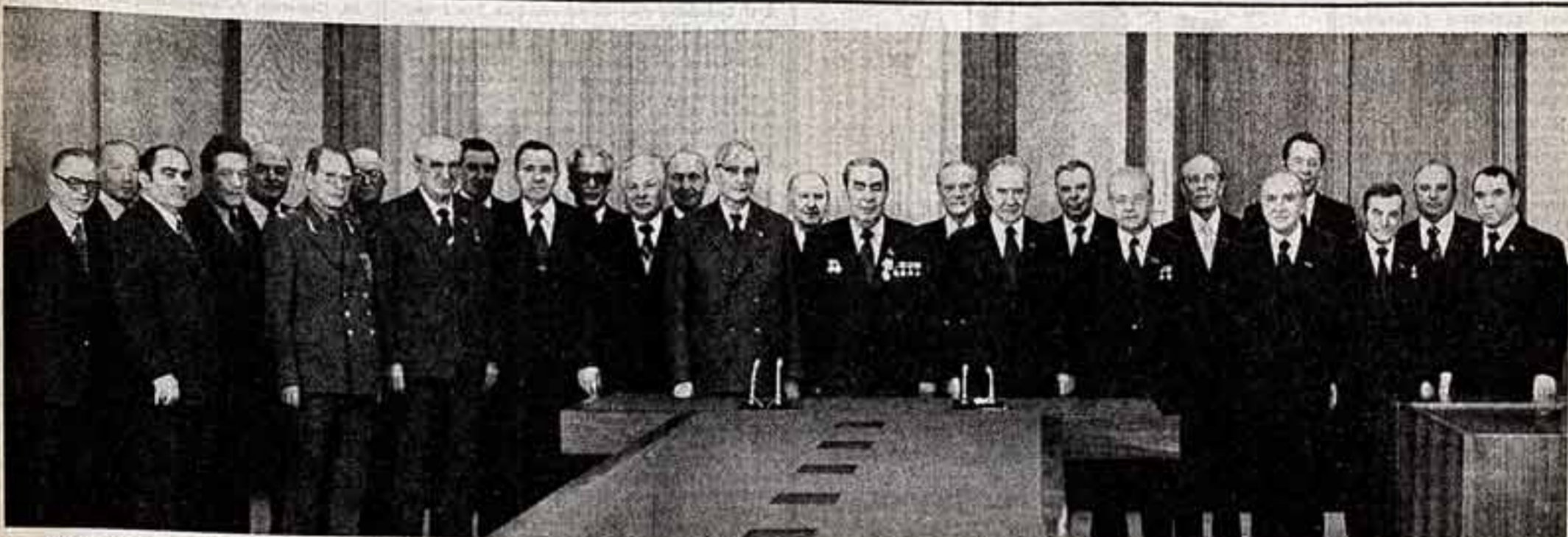
Во время вручения награды.