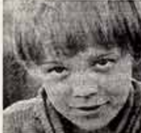
Вадим СОКОЛОВ. Кадр из фильма.