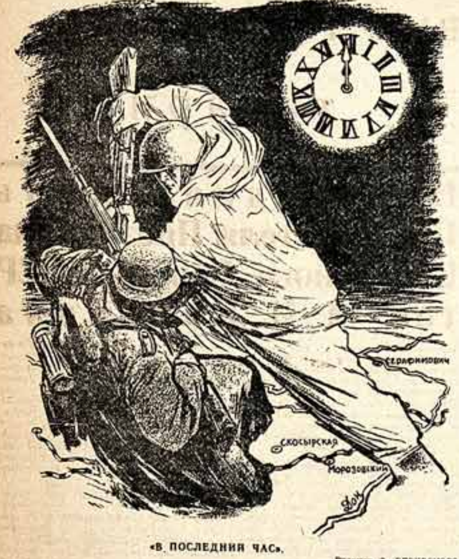
«В ПОСЛЕДНИЙ ЧАС»

Слышит голос наш в железном громе. В танку в стужу устремляй взгляд. А за нас сегодня в каждом доме. В каждой чаще тост провозгладем.