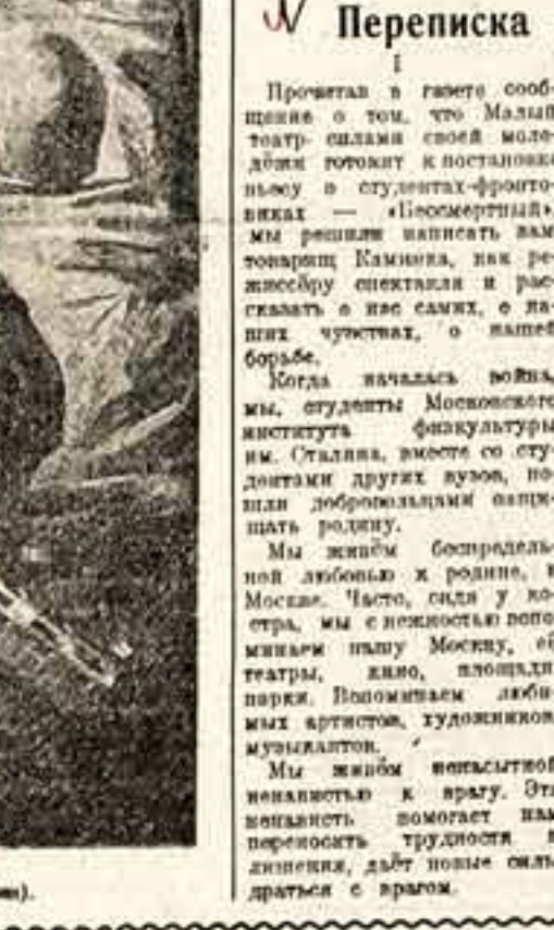
«Тесней, о нилые друзья, Тесней наш верный круг, составим...» (А. Пушкин).