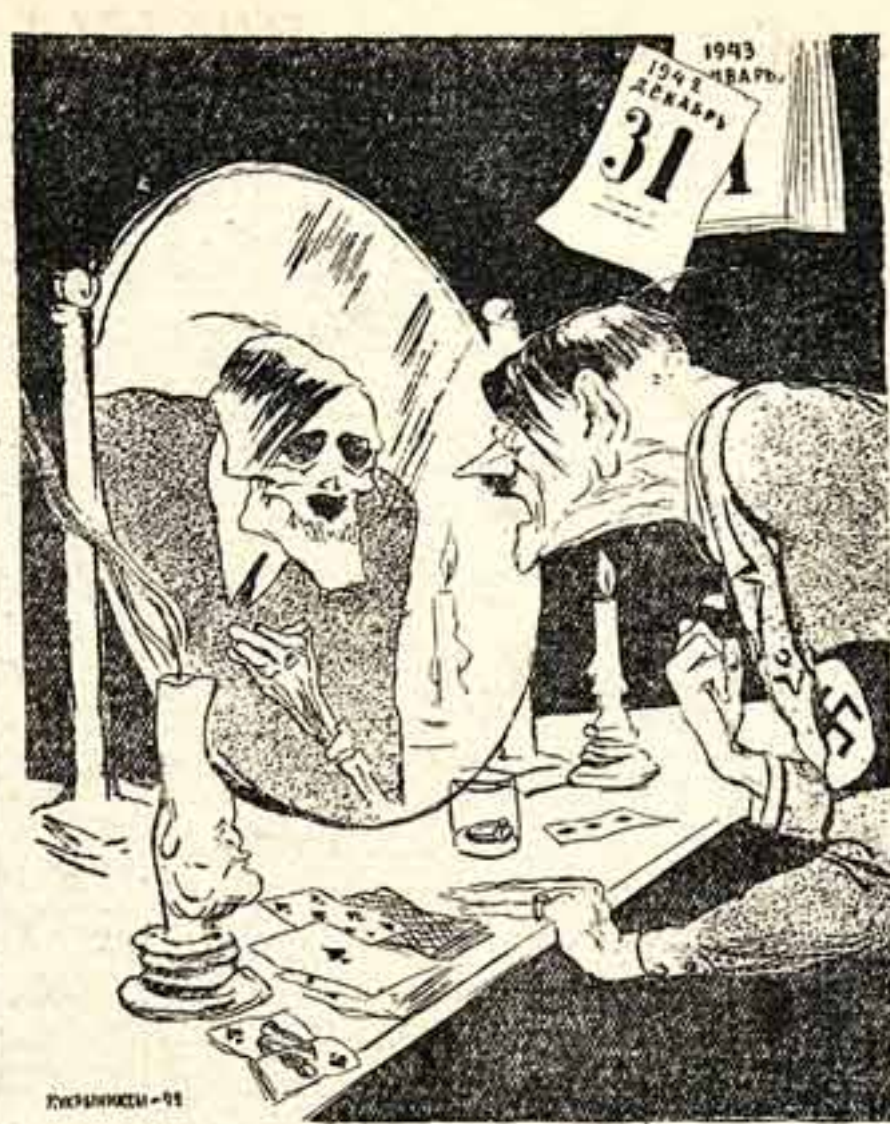
Новогоднее гадание. Рисунки художников ПУКМАННИКИН.