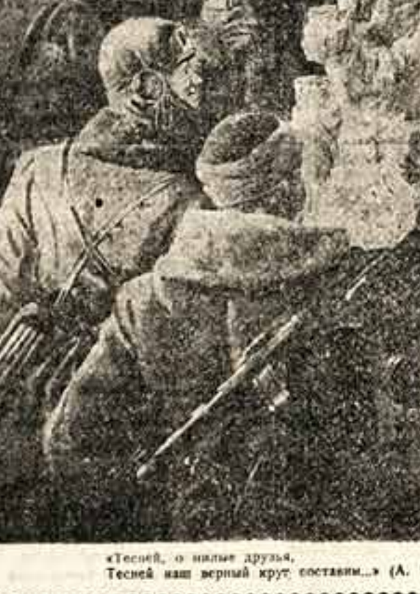
«Тесней, о нилые друзья, Тесней наш верный круг, составим...» (А. Пушкин).