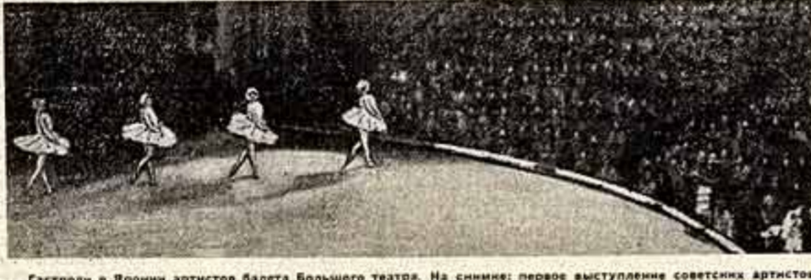
Гастроль в Японии артистов балета Большого театра. На снимке: первое выступление советских артистов в театре «Комэ» (Токио). Сцена из балета «Лебединое озеро».

Первое выступление артистов советского балета в Японии