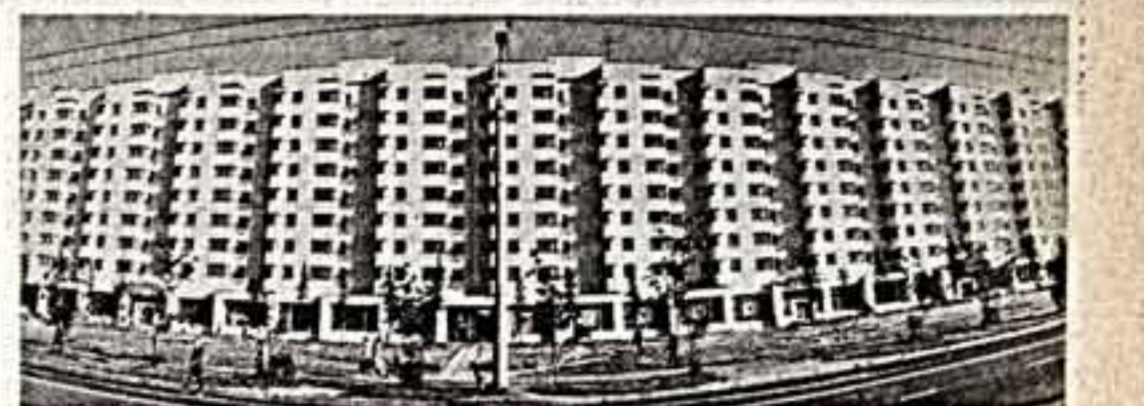
Архангельский дом книги переехал в новое помещение, расположенное в жилом доме на центральной площади имени В. И. Ленина. Торговая площадь теперь составляет 700 кв. метров. Здесь расположились отделы общесоюзной политической литературы, литературоведения, детской литературы, канцелярских товаров и отдела Северо-Западного книжного издательства. При Доме книги создан и активно действует клуб любителей книги, который объединяет сотни людей разных возрастов и профессий.

Союзу художников СССР, Союзу архитекторов СССР, Академии художеств СССР рекомендовано активнее претворять свою работу в духе решений XXVII съезда КПСС, улучшать деятельность республиканских творческих союзов и местных организаций, усиливать демократические начала в работе, всемерно внедрять принципы гласности, критики и самокритики, ответственного отношения и своему делу, укреплять связи с общественностью, стимулировать творческую и общественную активность каждого члена союза, повышать критерии требовательности при приеме в союз.