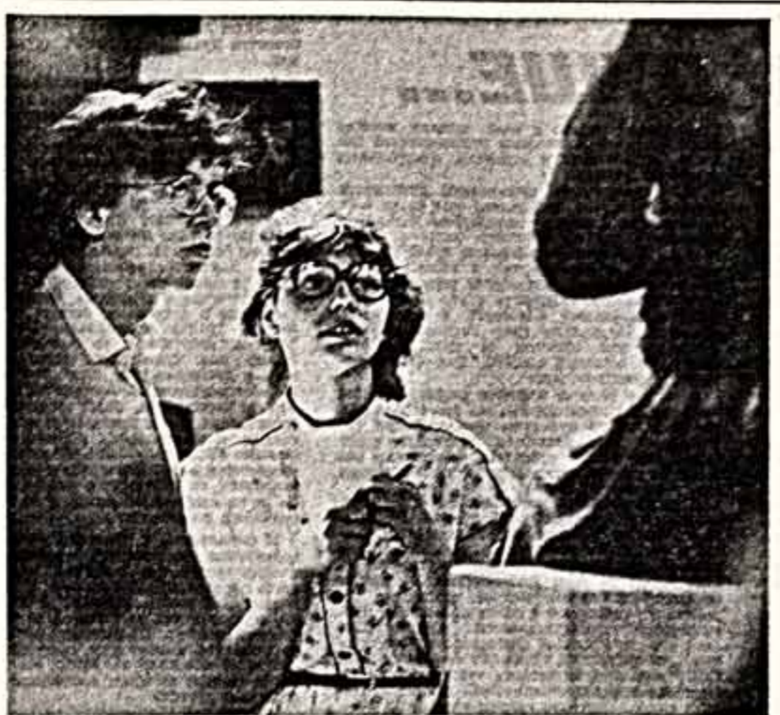
ФОТОКОНКУРС ● В. ИВАНОВ. На выставке верской деревенской скульптуры.

При таком положении играли бы были Министерство культуры ТАССР и газета «Вечерняя Казань» известить зрителей о наших гастролях? А если так случилось, то следовало бы, как нам кажется, газете известить перед своими читателями.