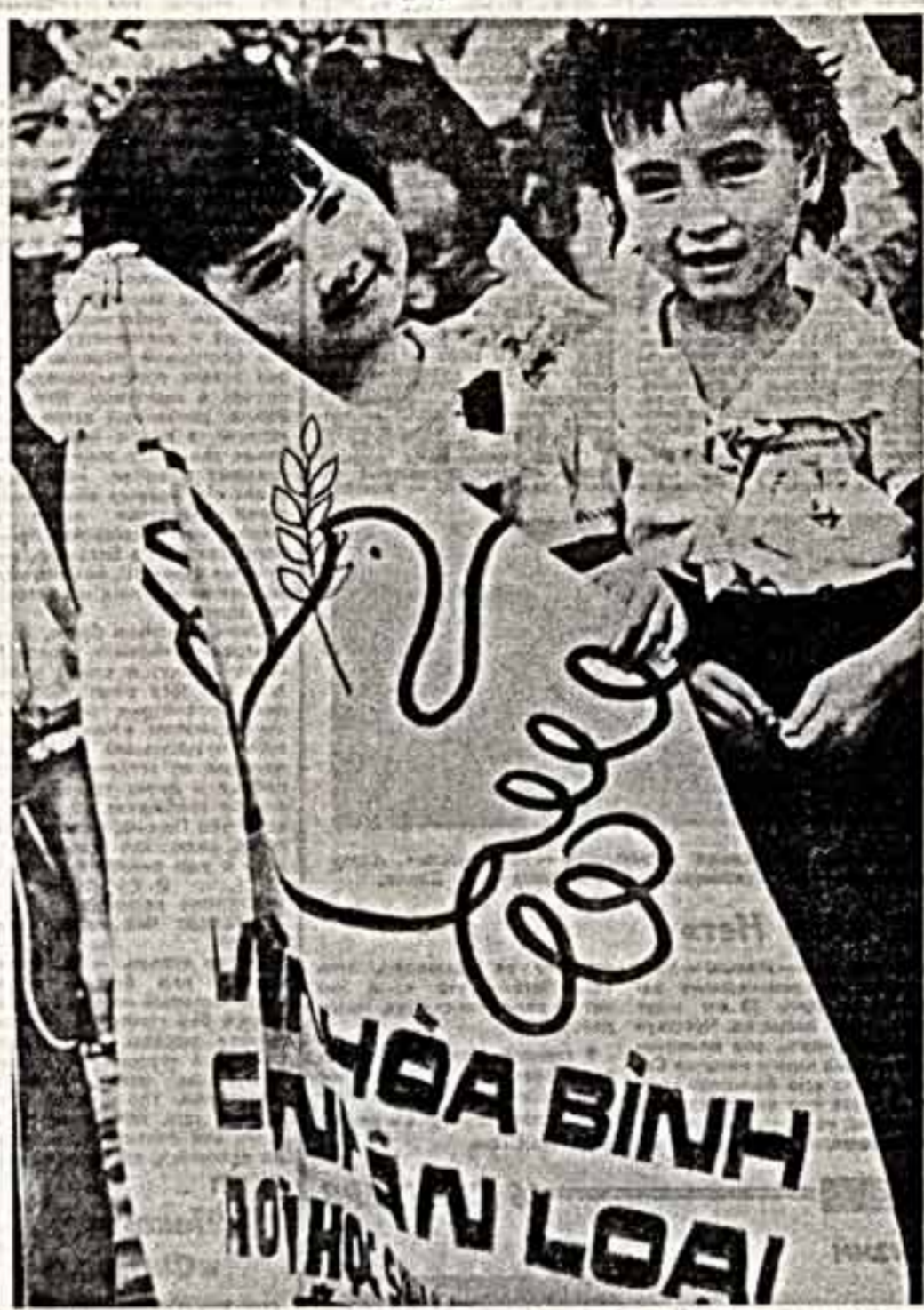
Дети движенья, в котором участвует все больше азиатских детей. — «Миллион писем в поддержку мира». Они пишут своим сверстникам в СССР, США, Франции... Одна мечта в миллионе разных писем: сохранить мир, счастливое детство.