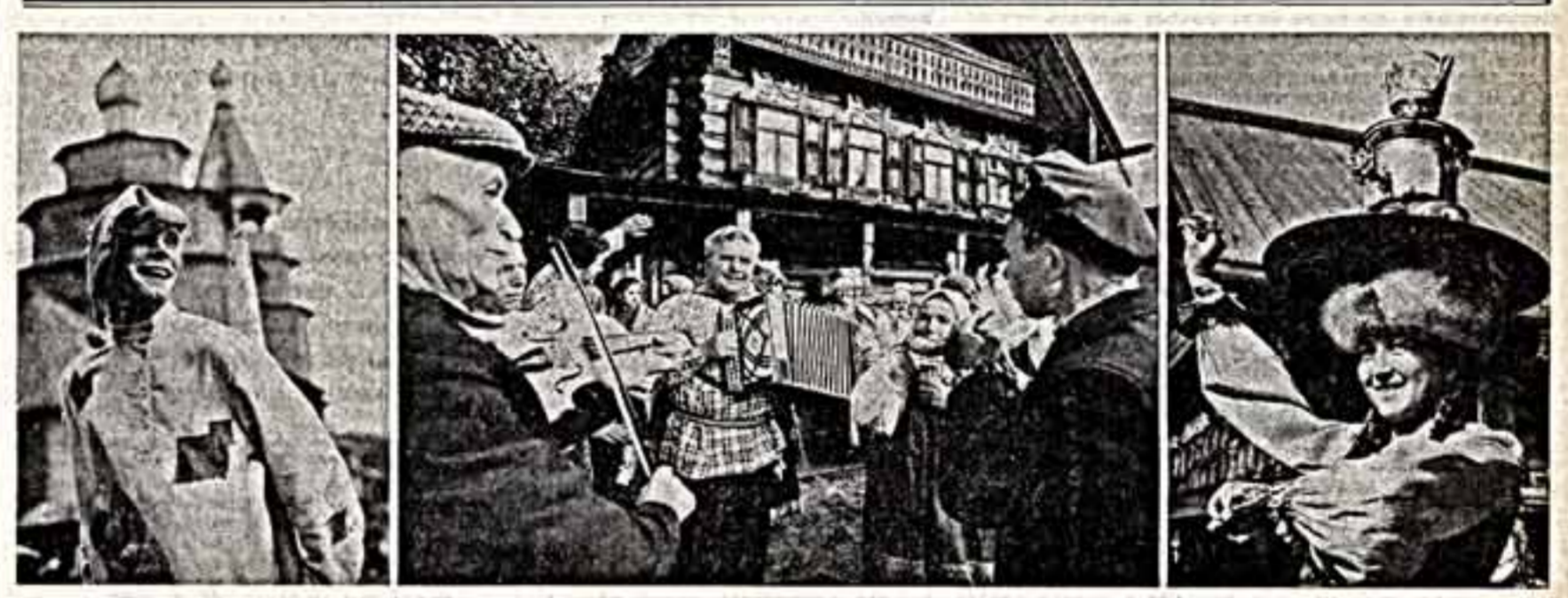
Ливень рухнул на сцену в разгаре танца. С новгородских небес сразу докатилось всем вволю — и артистам, и зрителям. Но танец сменился танцем, а аплодисменты — новыми аплодисментами...