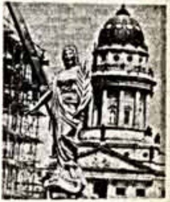
В связи с празднованием 750-летия Вергилия в столице ГДР осуществляется широкая программа художественного обновления исторических кварталов. Симон обделан на восстановительной и преждем востановленной Академии. В новой постройке будет великая купель. Неделю назад в Кабуле открылся женский факультет. На старом здании — здание Французского собора.

В Кабуле открылся выставочный прилагодный искусства, посвященный юбилею афганско-советского фестиваля молодежи, который состоится в Кабуле в дни проведения в экспозиции развлекательного центра «Дом культуры» (ДОМА), представлено свыше ста картин, рисунков, скульптур, изделий из керамики, а также авторами являются учащиеся общеобразовательных школ и техникумов Кабула, а также студенты и школьники афганской молодежи, принявшие участие в фестивале, проводимом по инициативе ВЛКСМ и ДОМА.