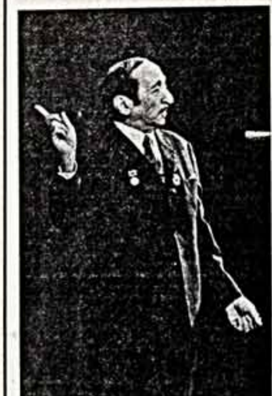
Исполнитель куколесого народного артиста СССР И. С. Набоков.