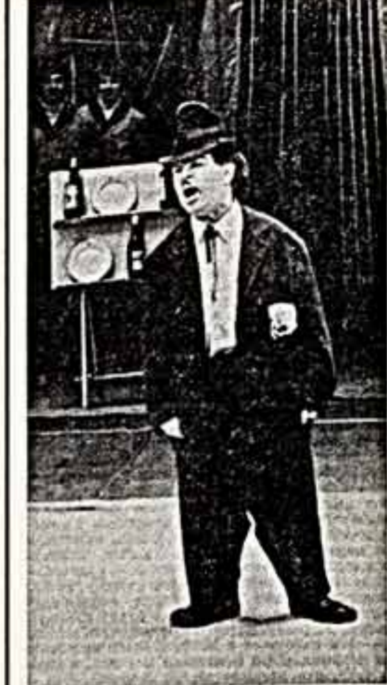
На модели — Карандаш. (Народный артист СССР М. Н. Гуманцев.)