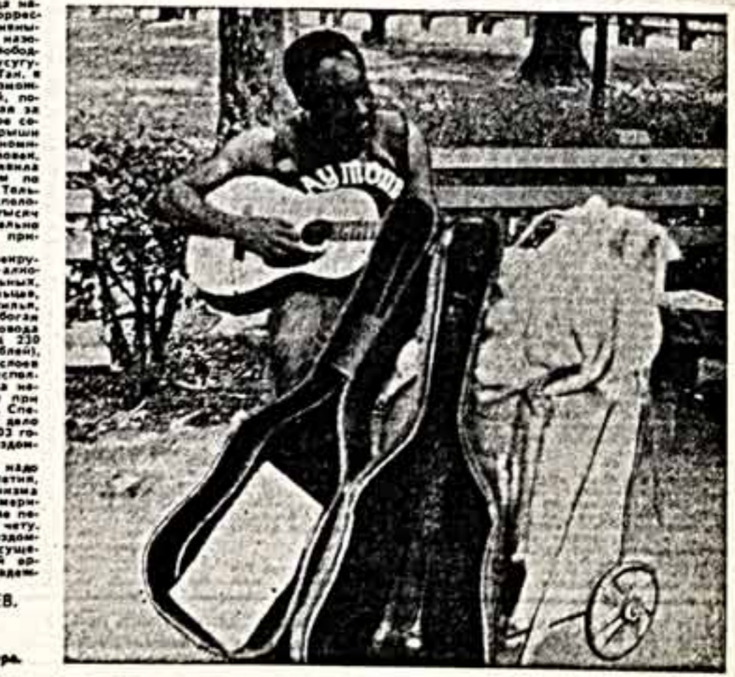
НЬЮ-ЙОРК — МОСКВА.

Эти снимки сделаны два года назад, во время работы автора корреспондентом в Нью-Йорке. Но архаичность, устаревшие их, тем, не менее, вещь. Проблема бездомных в свободном мире за это время лишь усугубилась, став катастрофической. Так, в США — этой «стране равных возможностей», администрация которой, по словам не слит, перемещает в «помещение со свободными» в мире социализма, число лишенных крыши над головой за период «реабилитации» достигло почти 4.000.000 человек.