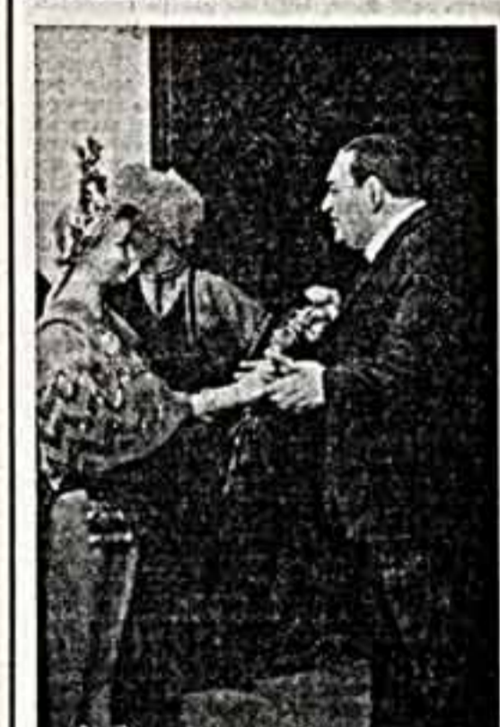
Народный артист СССР Л. О. Угрюмов в Центральном концертном зале.

Снимки 50-х — 60-х годов. Кинорежиссер Э. Каллов.