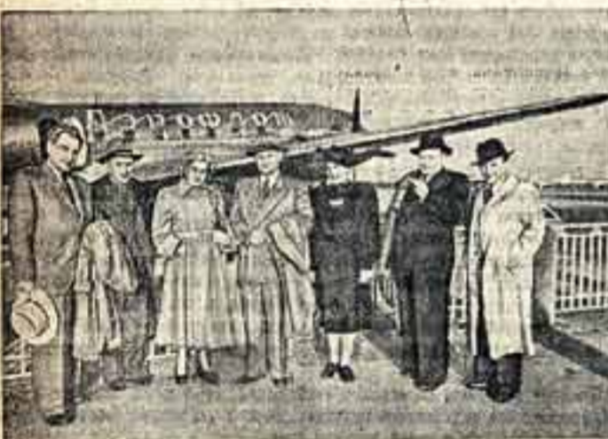
Делегация кинематографов СССР в составе Г. Александрова...