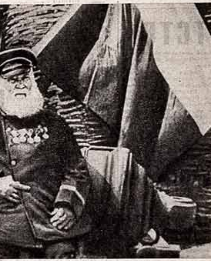
Этот кадр впервые появился на экране более шестидесяти лет назад.