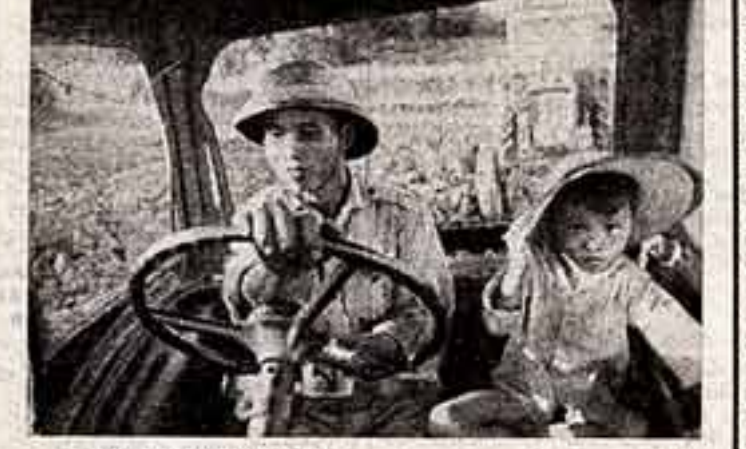
Кадр из кинофильма.

Мы знаем, что оно обязательно придет на израненную землю Вьетнама — первая весенняя весна. И она пришла, ибо нельзя даже силой современного оружия заставить покориться народ, как один человек, поднявшийся на борьбу за свою свободу и независимость. Полностью сбылись слова Хо Ши Мина, уверенно заявлявшего: «Какими бы ни были трудности и лишения, наш народ непременно одержит полную победу». Пусть сохраняются наши горы, реки и люди. После победы мы построим нашу страну — десять раз прекраснее, чем сегодня!»