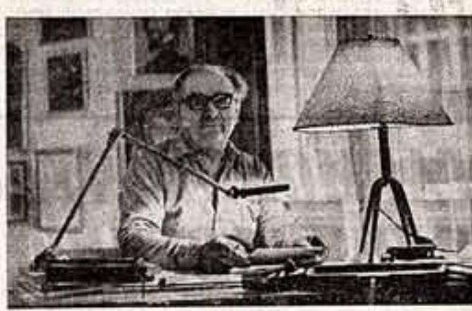
Художнику 62 года. Он влюблен в эстетику и творческих замыслов.

Автор этой гравюры — известный венгерский художник Ференц Бордэш. Он рассказывает о Будапеште так, словно спроектировал и построил каждый его дом, соорудил все его памятники. Он любит свой город, и значительно часть своих произведений посвящена ему.