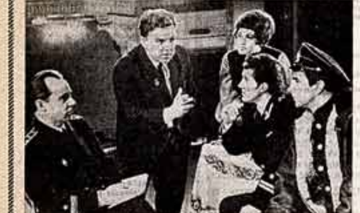
На репетиции спектакля «Море должно быть справа».