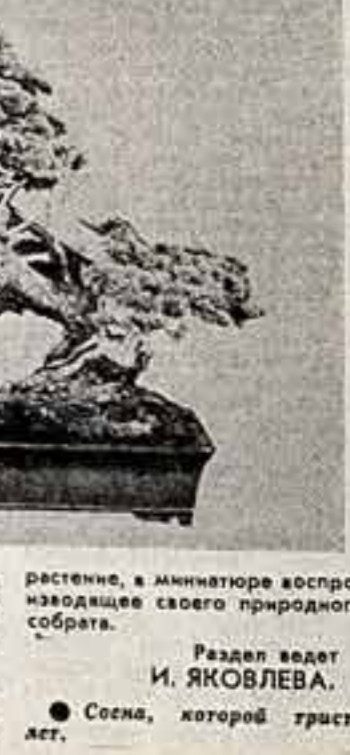
Резал ветвь И. ЯКОВЛЕВА. © Сома, которой триста лет.