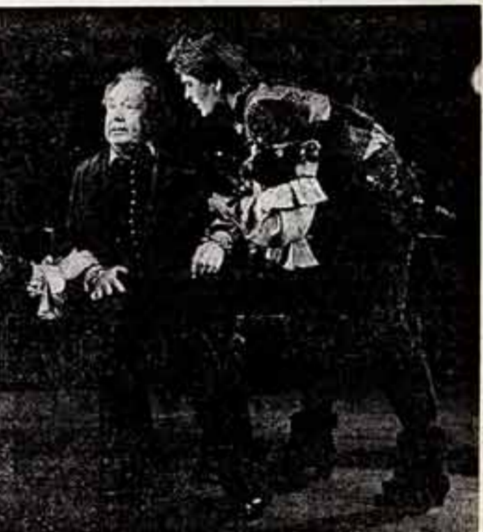
Национальный театр Будапешта показывает в Москве на сцене МХАТ «Тартюф» Мольера.