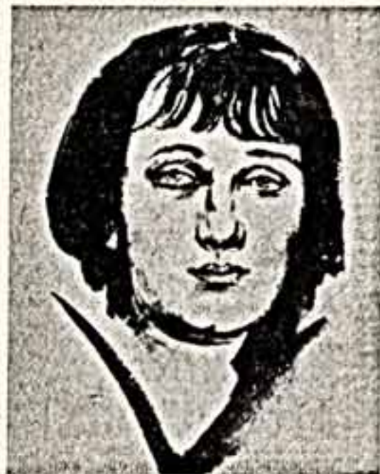
Н. ТЫРСА. Портрет А. А. Ахматовой.

Уверен, такая переписка быстро завоеует популярность.