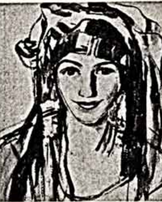
З. СЕРЕБРЯКОВА. Автопортрет.

Раз уж об этом зашел разговор, давайте подлить небольшую ложку дегтя в бочку с медом — и несколько скептически отнесусь к идее музея личных коллекций. Если у Пушкинского музея, этого ябберга, большая часть богатств которого находится в хранилищах, появляется дополнительная экспозиционная площадь, неужели во имя красивой вывески