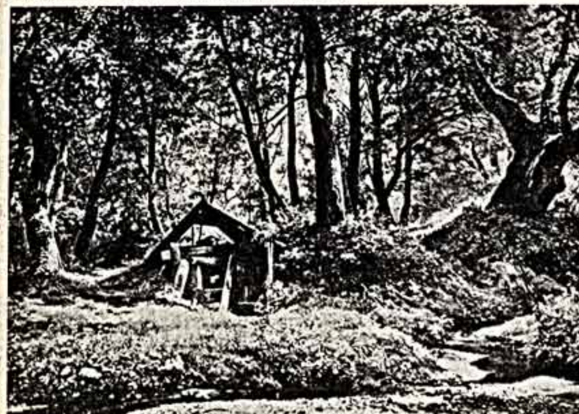
Н. ШИШКИН. Солнечный лес.