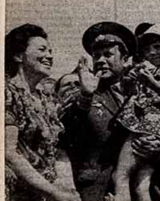
Теплая встреча героев в Звездном городке.

Горячо благодарим Центральный Комитет КПСС, Президиум Верховного Совета СССР и Совет Министров СССР за оказанное нам доверие по осуществлению космического полета.