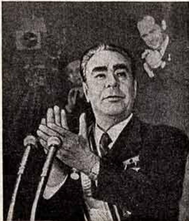
Торжественное заседание сейма. На трибуне товарищ Л. И. Брежнев.

За новые достижения в освоении космоса звание почетного гражданина Калужской области П. Р. Поповича был удостоен этого звания ранее, после первого своего полета в космос в 1962 году.