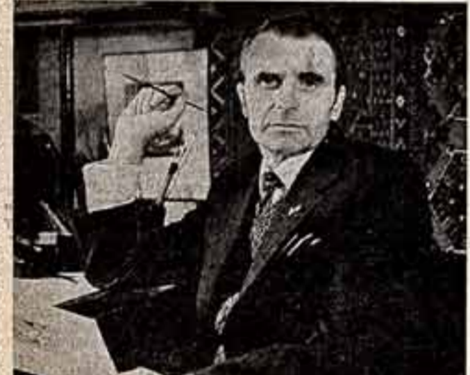
Сотни почтовых марок и конвертов создал московский художник Евгений Акимов. Недавно Министерством связи СССР выпущено почтовое издание из серии «Славим дела твои, Октябрь». А сейчас он работает над серией почтовых миниатюр, посвященных отечественному авиостроению.