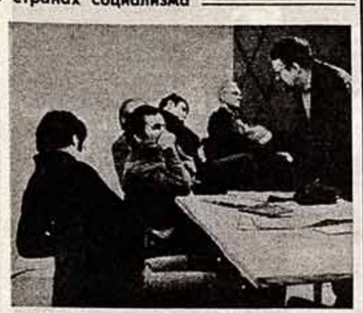
Сцена из спектакля «Протокол одного заседания».

В репертуаре Берлинского театра имени М. Горького уже второй сезон заметное место занимает пьеса А. Гельмана «Протокол одного заседания».