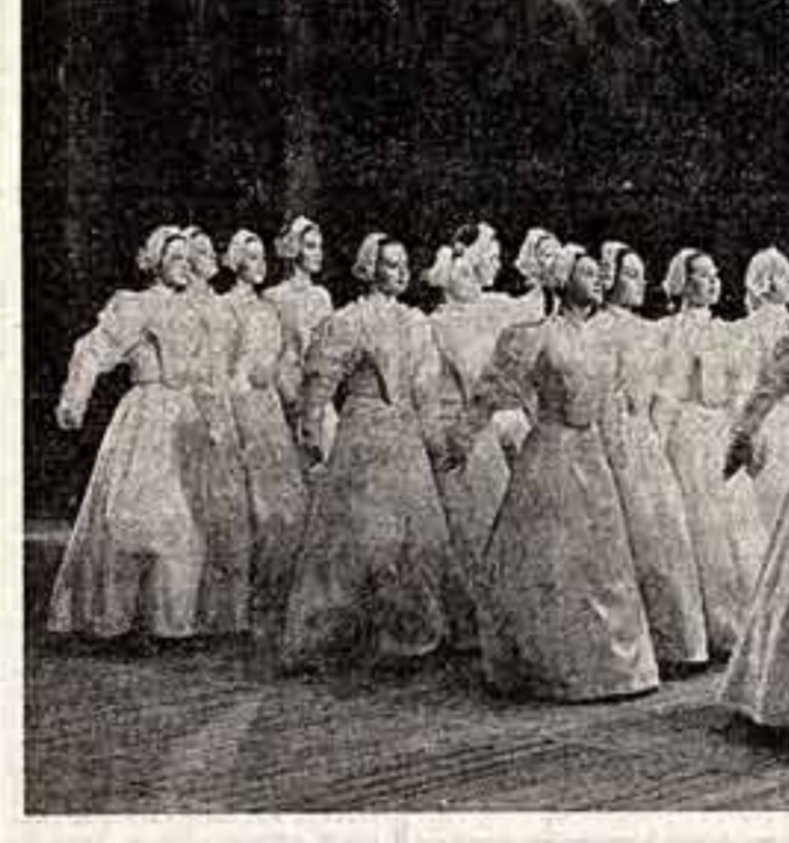
Выступления народного ансамбля танца «Волжанка» Дворца культуры Профсоюзной. Фото Б. Саранцева (ТАСС).