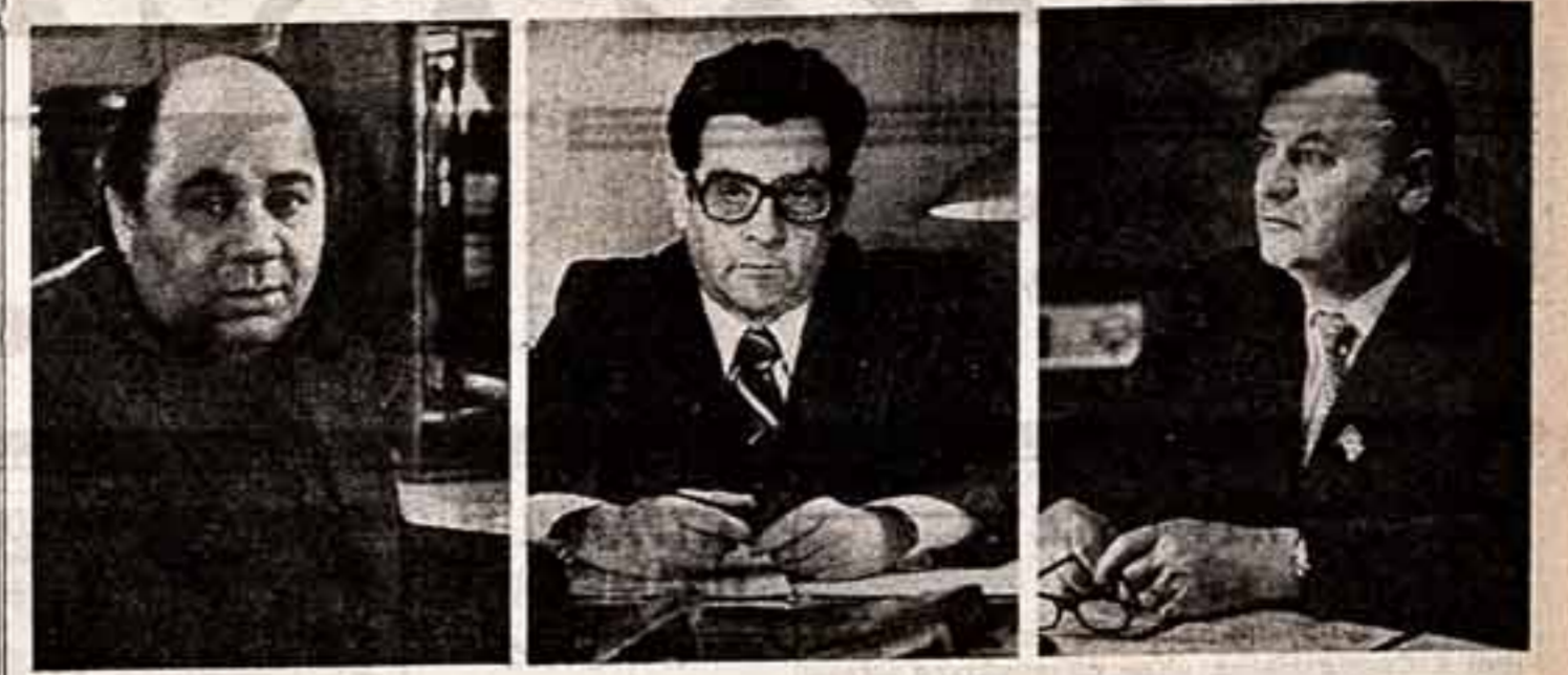
Е. Леонов, народный артист РСФСР — за художественный фильм «Преиша». В. Зорин, доктор исторических наук, автор сценария — за цикл документальных телефильмов «Программа жизни и деятельности». М. Алексеев, писатель — за роман «Наука не лгуна».