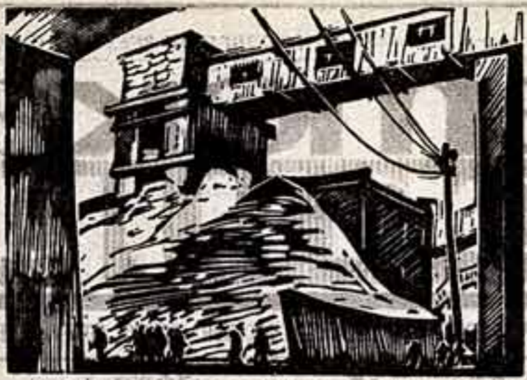
В. Новиченко. «Орско-Халиловский металлургический комбинат. г. Новотроицк». (Из серии).

Процесс привнесения человеческого образования, культуры будет развиваться, и все больше и больше будет в жизни людей, владеющих самым широким знанием. Положительное искусство в связи с этим потребует новых критериев. Что бы оно оставалось личностью в искусстве, каждому на нас предстоит совершенствоваться и развиваться.