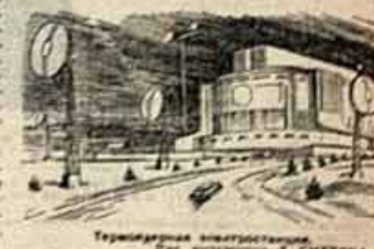
Терминальная электростанция. Рис. художника Д. СМЕЛОВА.