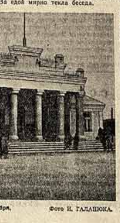
Дом культуры Малкова имени 13-й годовщины Октября.

Лень весенний Пожог и светел... Николай ЕФРЕМКИН.