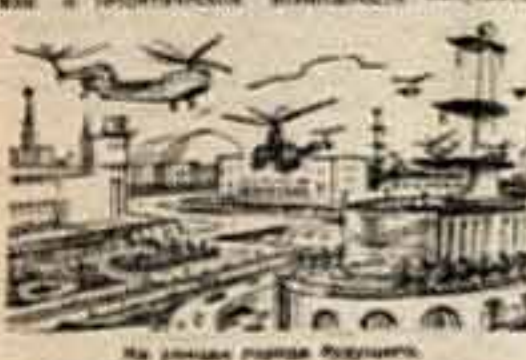
На рингах города Ленинграда.