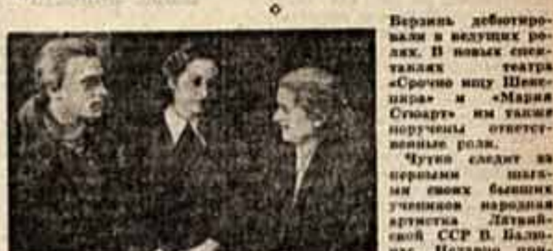
Сцена из спектакля «Как важно быть серьезным».