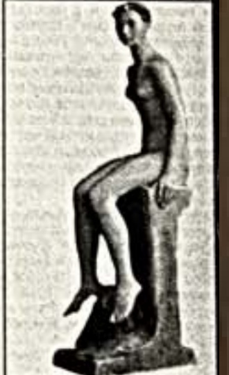
Е.Гатилова. "Море штормит". 1978 г.