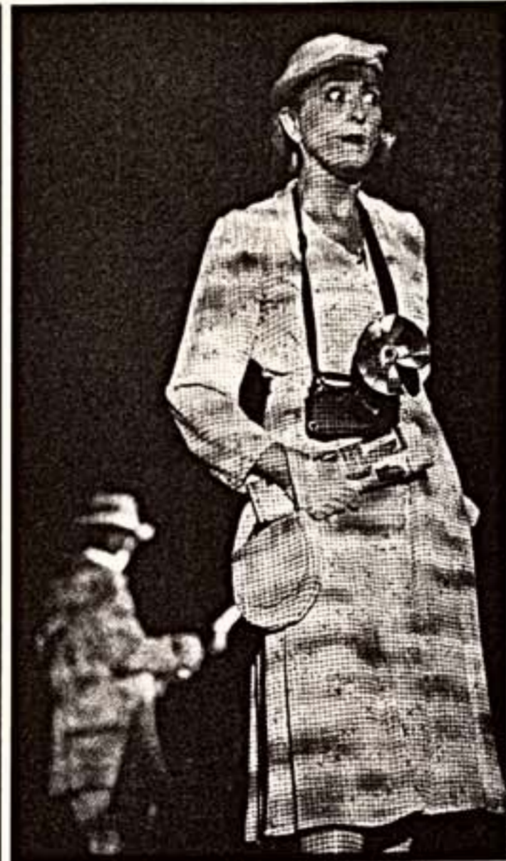
Труппа "Два мира", существовавшая с 1973 года, - гости II Европейского фестиваля современного танца в Москве. Она по собственному выбору привезла спектакль "Лейтмотив" (премьера состоялась в 1996 году), который трудно отвести к области танцевального искусства...

Канадские гости на фестивале современного танца Европы