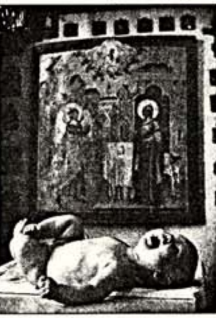
Слева: "Москва. В Кремль". В центре: "Где только не ступала нога человека?". Справа: "Рождение". 1970 г.