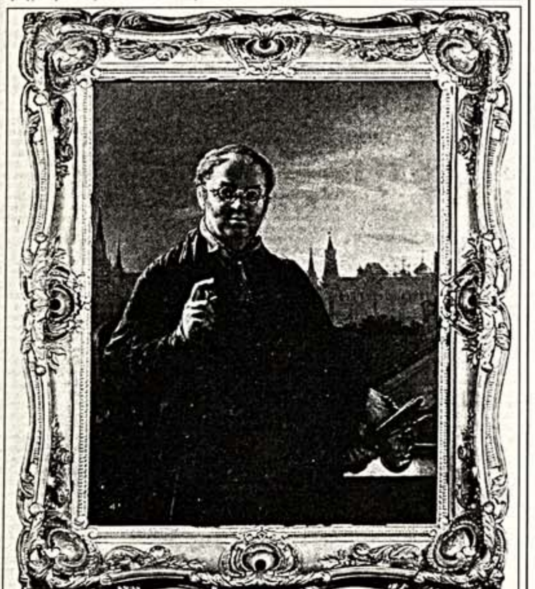
В.Тропинин. "Автопортрет". 1844 г. Выполнен на фоне окна в доме на Волголке

Столь тревожное положение усугубляется и страшной теснотой. Разрозненные фонды размещены сейчас в крошечных комнатах небольшого особняка усадьбы с большим трудом, с нарушением всех негласных норм хранения и экспонирования. Даже хранение живописных холстов и графических листов вызывает обоим опасение. Нет специального выставочного зала, комнаты для лектория. Эти совершенно не юбилейные ситуации требуют скорейших к себе внимания высшей должностной лицы, от которых зависит территориальное расширение музейных площадей. Тем более что выход есть. Речь идет о передаче музею дома номер девять на Волголке. Того самого, где жил и работал Тропинин, что удостоверяет мемориальная досочка. В этом доме он нарисовал знаменитый "Автопортрет" с видом на Московский Кремль, там же создатель хрестоматийный портрет А.С.Пушкина. В доме на Волголке велел поэт позачиниться с Карлом Брюлловым. Сейчас, по некоторым сведениям, жильцов из дома выселяют и помещения готовят к основательному ремонту. А что с ним будет дальше? Этот дом — единственный в Москве, бесспорно принадлежащий Тропинину. И его можно вернуть законуму владельцу. Евграф КОНЧИН