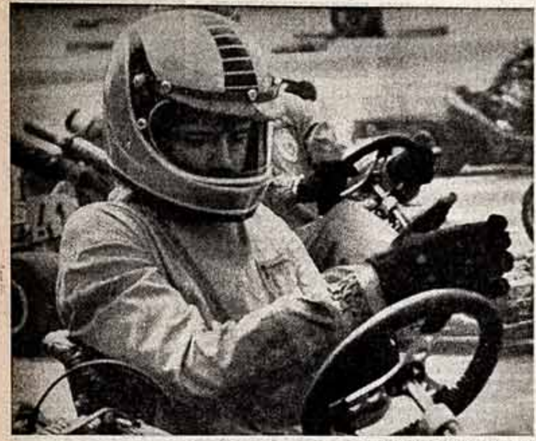
ФОТОКУРС Перед стартом.

ПРЕМЬЕРЫ ТЕЛЕВИЗИОННОЙ НЕДЕЛИ С 16 ПО 22 АВГУСТА