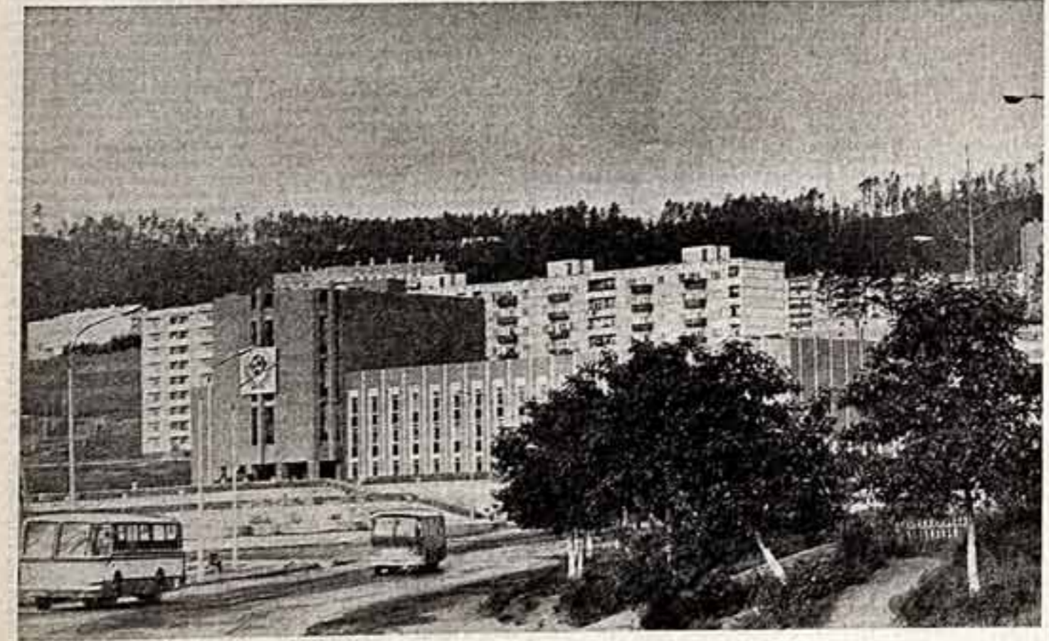
Новый Дворец культуры открылся в Усть-Намске. Он принадлежит комитету профсоюз Усть-Намской гидроэлектростанции. В художественных кружках и ансамблях дворца занимается больше тысячи человек.