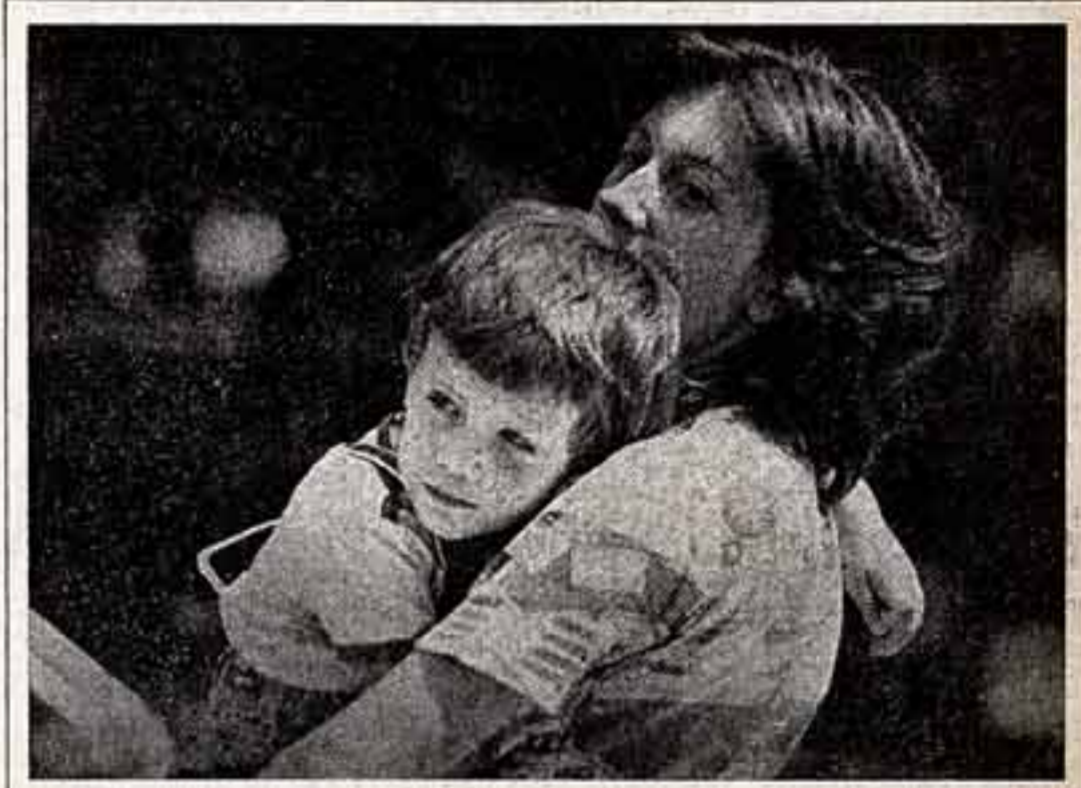
Пусть всегда будет солнце...