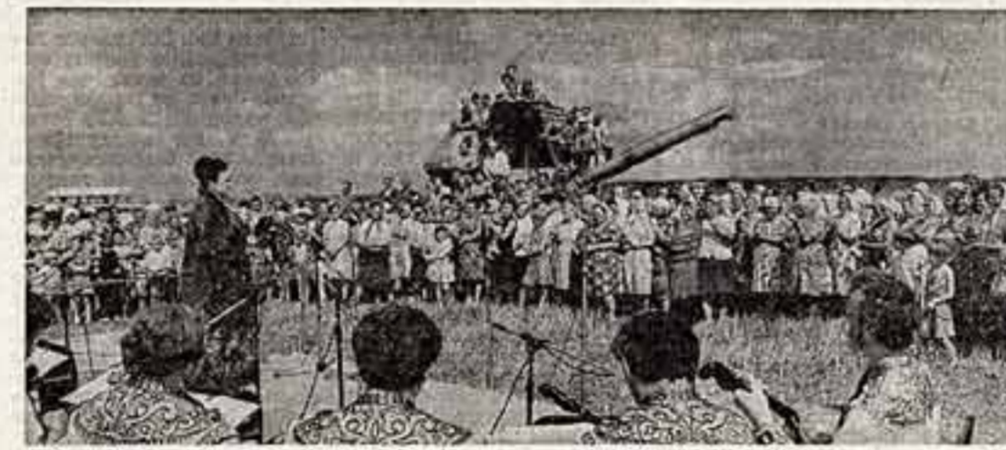
Народная артистка СССР, лауреат Ленинской премии Людмила Эмкина среди хлеборобов ордена Трудового Красного Знамени колхоза «Заря коммунизма» Ровенской области.