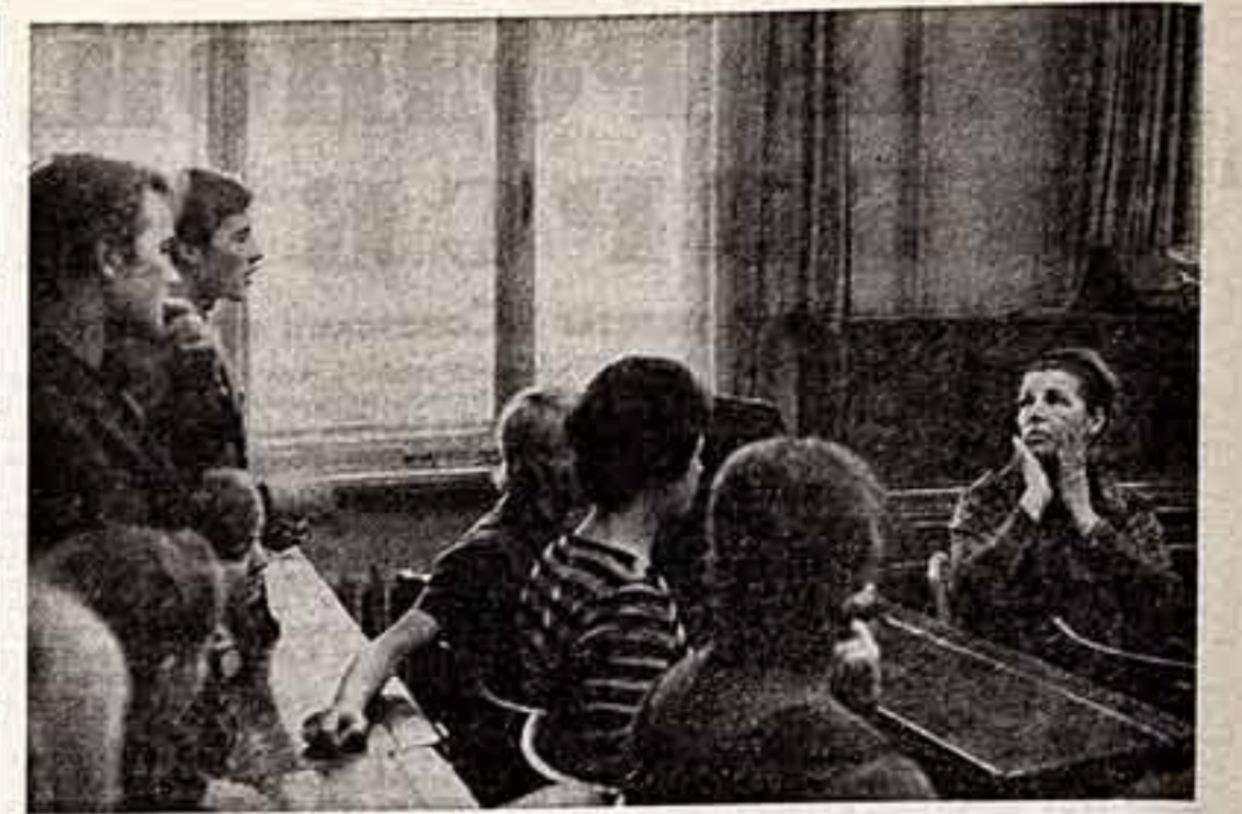
Тамара Макарова. Нашим представлениям об истории и сегодняшнему дне советского кино, органично соединившей в себе талантливой актрисы.

«Семеро смелых» и «Комсомольск», «Маскарад» и «Молодая гвардия», «Учитель» и «Непокоренные» — один лишь перечень ролей, сыгранных Тамарой Федоровной в эти и другие фильмы прежде лет, говорит очень много миллионным зрителем среднего и старшего поколения. Но и последние два десятилетия подарил