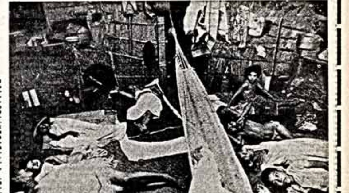
Сальвадорские женщины и дети в лагере беженцев на территории Гондураса.