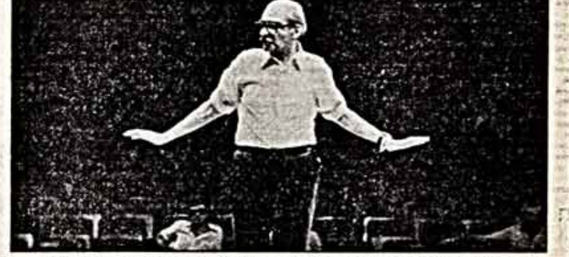
Грузинский государственный театральный институт имени Шота Руставели готовит авторов театра и кино, театроведов, режиссеров, авторов музыкальной комедии...