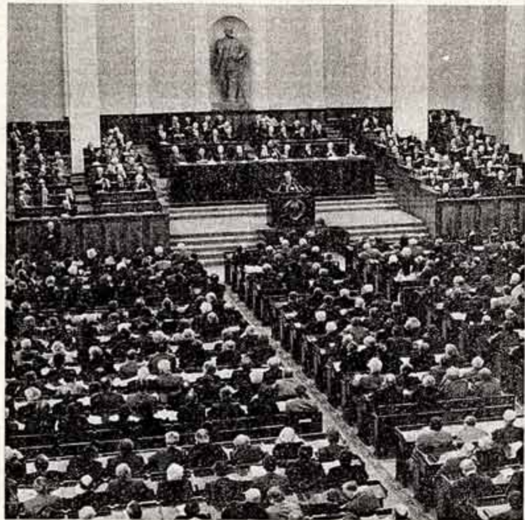
Москва, Кремль. 10 апреля 1985 года.

Мы горючо поддерживаем избрание товарища Горбачева на высший пост Генерального секретаря Центрального Комитета КПСС. Дорогой Михаил Сергеевич! Примите от всех нас сердечные поздравления доброго здоровья, больших успехов в Вашей деятельности на благо советского народа, во имя торжества великого ленинского дела.