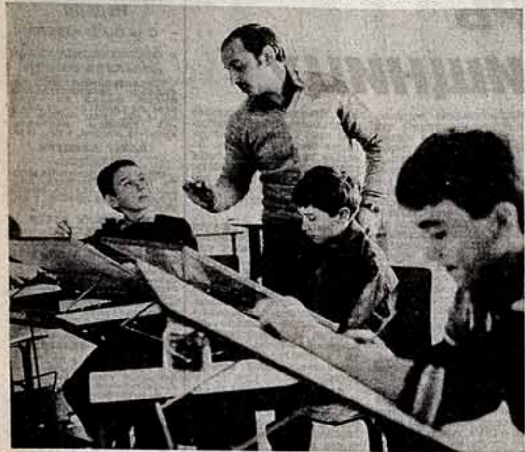
В старинном болгарском городе Смолян, что расположен в самом центре Родопских гор, новое поколение соседствует со старым. В одной из современных картин города высятся здания средней школы имени Георгия Димитрова, архитектура которого удачно сочетается с контурами родопского пейзажа. Для семилетних школьников созданы отличные условия для занятий и для внеклассной работы. Особым успехом пользуется кабинет изобразительного искусства. Под руководством профессиональных педагогов ребята овладевают тайнами рисунка.