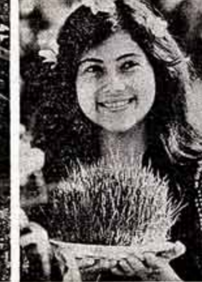
По земле Советского Таджикистана шествует весна. Встречают ее лесники, танцоры, которые сопровождают первый сев. ● Сидит ессу карбы. ● Идут полевые работы в колхозе имени В. И. Ленина (Кулябская область). ● Вяздо с просошими зернами — символ богатого урожая.