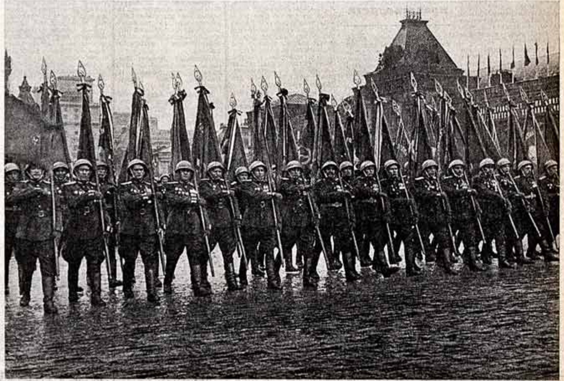
Москва. Год 1945. Парад Победы.

Вместе с труженниками тыла и бойцами фронта добивались победы в войне писатели, поэты, композиторы, художники, артисты. Советским оружием — кинжал, стихами, музыкой и песнями, средствами изобразительного искусства и художественными образами — они воспитывали в советских людях ненависть к врагу, любовь и Родине, укрепляли уверенность в победе над фашистскими поработителями. Так, например, толь-