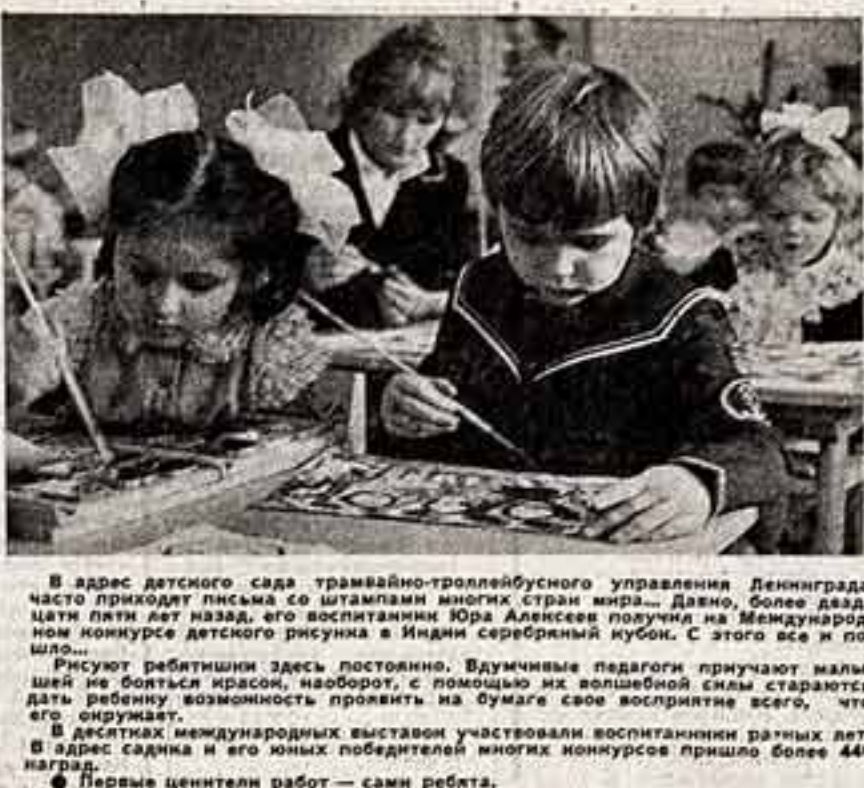
В адрес детского сада трамвайно-троллейбусного управления Ленинграда часто приходят письма со штампами многих стран мира...