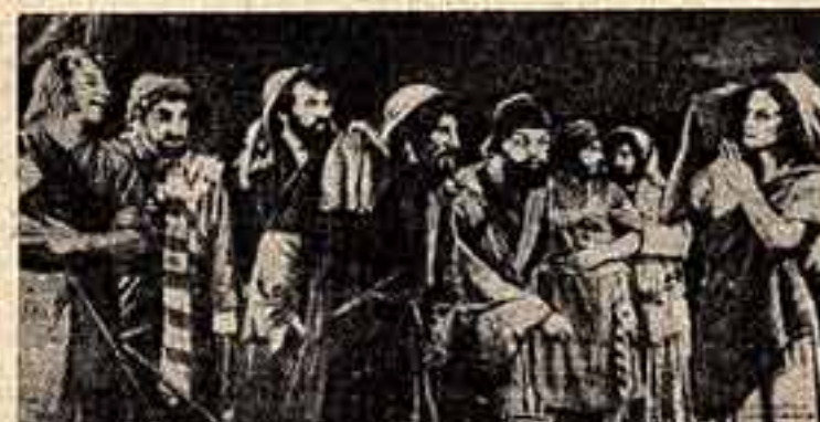
Наибольший интерес на «Приключенческой трагедии» Вс. Вишневского вызвал спектакль Академического театра драмы Латвийской ССР «Иосиф и его братья». Эту пьесу Я. Райниса впервые на нашей сцене поставил А. Антман-Бриедит.