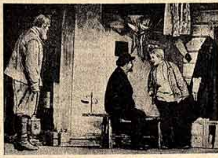
Спектакль Московского Художественного академического театра им. Горького «Кремлевские курьезы» стал одним из примечательных событий сезона. На сцене: сцена из первого акта.