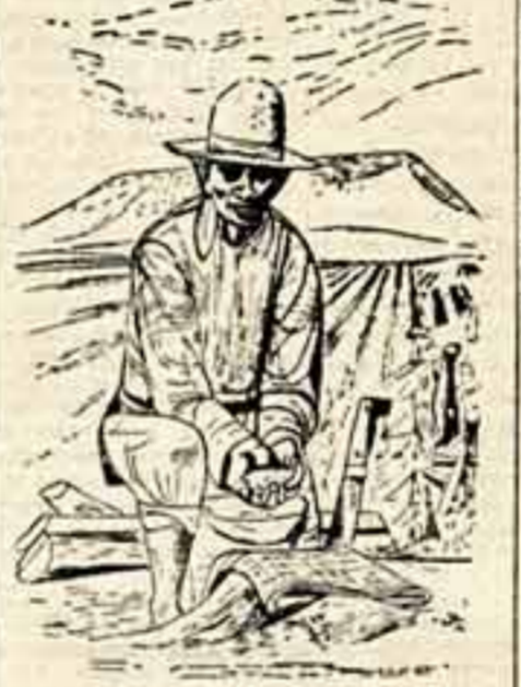
Гватемальский фермер на своем новом земельном участке.