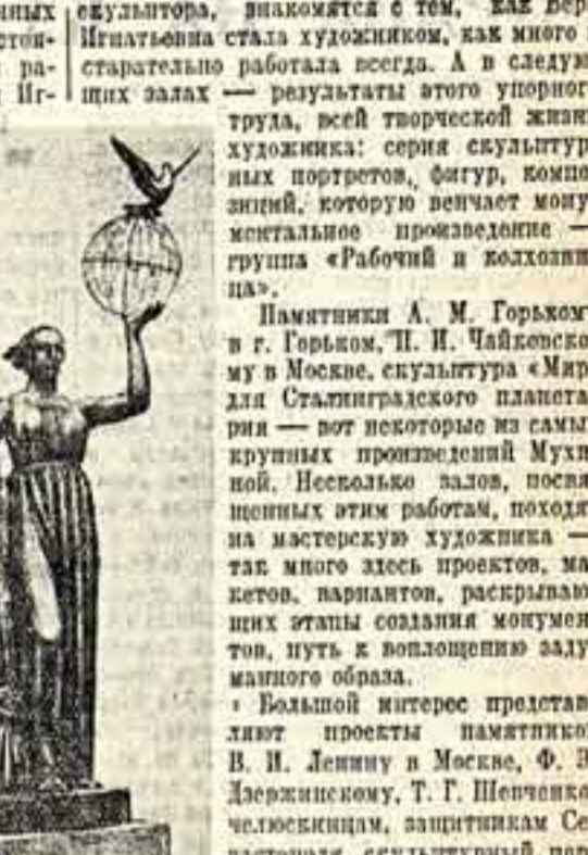
«Мир» — проект статуи для здания планетария в Сталинграде. Выполнен совместно с С. Сергеевым.