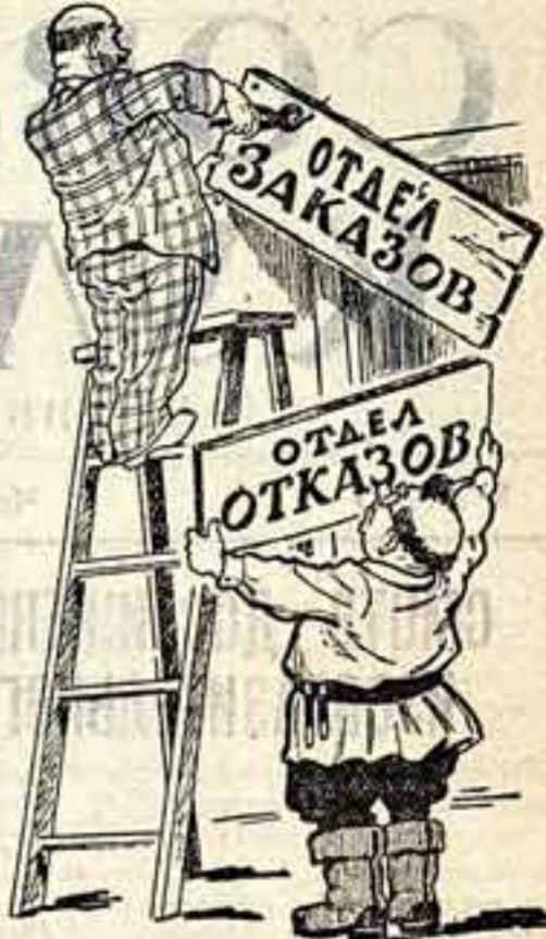
Рис. М. Малоземского и А. Орлова.

Если заказчик просит, например, выслать брошюру, которая весит 110 граммов и стоит 45 копеек, то при получении ему следует уплатить за нее 2 р. 95 коп. Нельзя ли сделать так, чтобы Министерство связи установило специальные тарифы для «Книга—почтой»? Удвоят ли это, что «Книга—почтой» фактически лишено права на получение художественной, критико-публицистической и детской литературы. А ведь в политической соответствующими начальственными инструкциями прямо сказано, что «заключительный отдел» «Книга—почтой» является удовлетворение потребностей трудящихся в политической, социально-экономической, научно-технической, сельскохозяйствен-