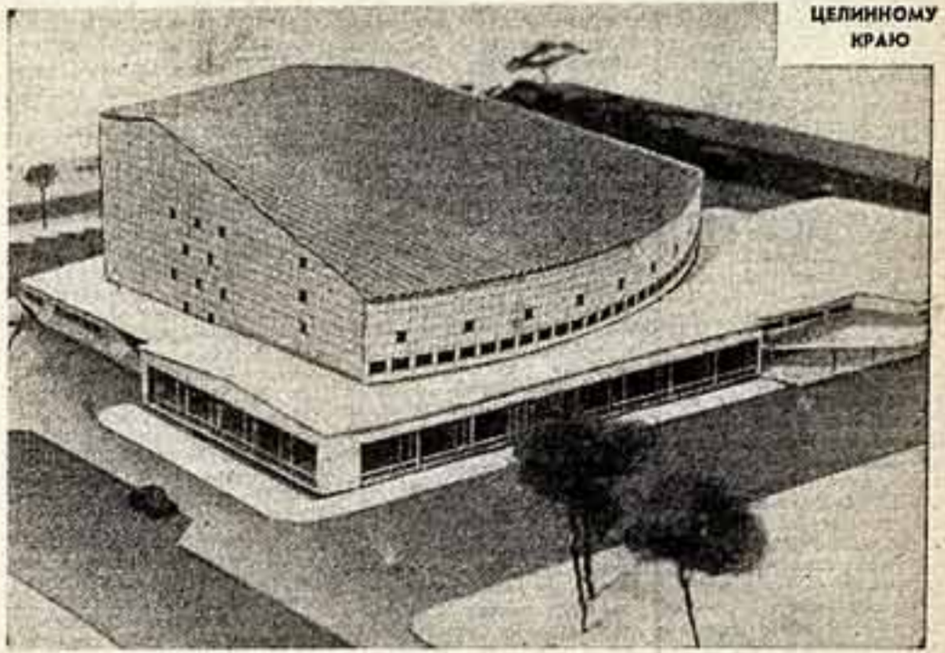
Климатические условия в Целинограде ниже, чем в Прибалтике: расчетная температура ниже на 15°.

ТАК примерно будет выглядеть общественный форум Целинного края. Значение этого сооружения для Целинограда далеко выходит за пределы обычного кинотеатра. Зал, решенный пологим амфитеатром, вместит около двух с половиной тысяч зрителей. Обширная эстрада, арка которой в специальной ямке сможет расположиться симфонический оркестр, предназначена для показа больших концертных программ. На универсальном экране шириной более 30 метров будут демонстрироваться, помимо обычных, широкоформатные и широкоформатные фильмы. Кроме того, здание рассчитано на проведение конференций, слетов передовиков сельского хозяйства.