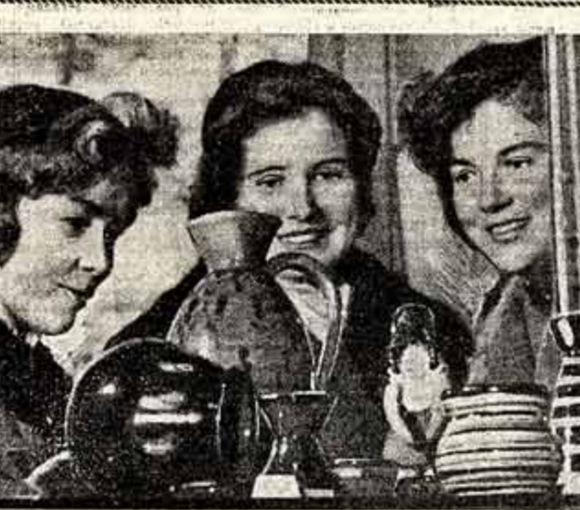
Латвийская ССР. Девизом для преданных республиканцев...