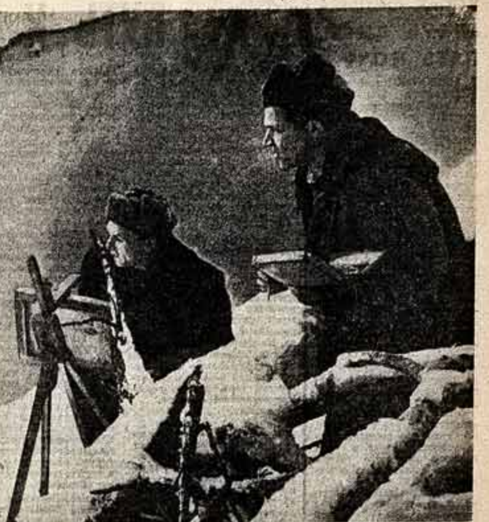
На этюдах в Подмосновье.

Стремся достичь все это до зрителя, автор с самой искренней горячностью обрушивается на обязательность, бес-