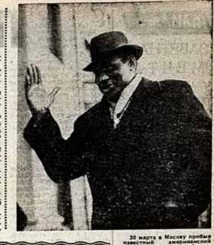
30 марта в Москву прибыл известный американский певец и общественный деятель Пал Робсон...

ВЛАДИМИР ИЛЬИЧ ЛЕНИН. Плакат из 20 открыток. Мозаика. Цена 30 коп.