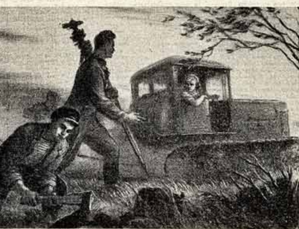
П. Баранов, «Покорители целины», Автолитография.

Люди — вот одна из главных проблем целины. В ближайшие годы Целинному краю предстоит довести культуру до 750 миллионов пудов. Это больше, чем, скажем, должна дать Украина, которая еще недавно была всесоюзной житницей. Но если в Целинном крае население всего лишь три миллиона, то на Украине столько же, но в восемь раз больше.