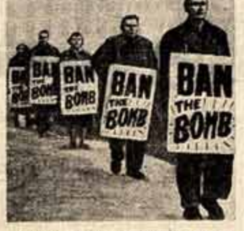
Английский народ выступает против атомного, водородного и другого оружия массового уничтожения. На снимке — демонстранты несут плакаты: «Запретить бомбу!».