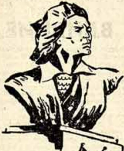
Памятник Салавату Юлаеву.