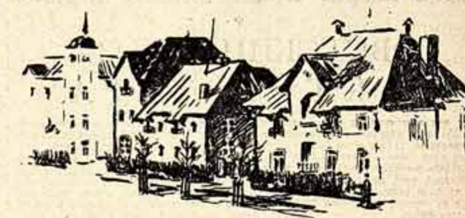
...Недалеко от будущего центра.

Создание мощной производственной базы, на которую ушли первые годы строительства, окулат себя строительством. Почти все, что нужно для строительства, производится на месте: кирпич, бетон, шифер, оронные рамы, двери, лепнина и даже комнатные люстры. Прошло всего пять лет, а в городе уже десятки асфальтированных улиц и бульваров, переселенческих под прямым углом. Все они обсажены аккуратно под-