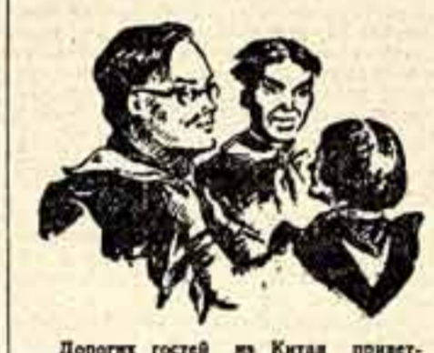
Дорогих гостей из Китая приветствуют пионеры.

Предмет законной гордости жителей Салавата — медицинский городок. В нем сосредоточено большинство лечебных и профилактических учреждений города. Выделяются окрашенные в шоколадный цвет трехэтажные корпуса, где расположились терапевтическое, хирургическое, инфекционное отделения поликлиники. Прекрасная мебель,