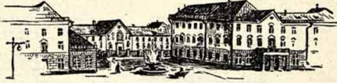
Санитарный городок оборудован по последнему слову медицинской техники.

А. ЭРНСТЕМ, спец. корр. «Советской культуры» Г. САЛАВАТ, Башкирская АССР.