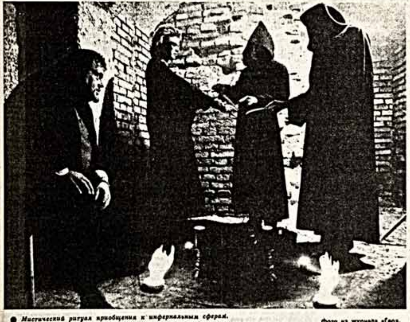
Мистический ритуал приобщения к иерфериальным сферам.