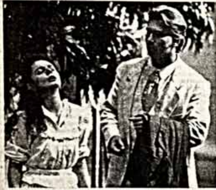
В ПАРИЖСКОМ ТЕАТРЕ ШАТЛЕ ПОЯВИЛИСЬ ВЫЗЫВАЮЩЕ СОВРЕМЕННАЯ ВЕРСИЯ «ЕВГЕНИЯ ОНЕГИНА»

У молодой итальянки — чудное сопрано, но она не всегда чувствует нюансы русского текста, очень сложного в эмоциональном плане.