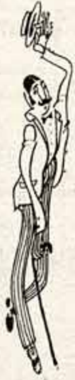
Рисунок К. Валова.

Во всем его облике было что-то до стандартности типичное для людей его круга и достатка. Черные волосы на прямой пробор, нагловатые глаза и лицо самоуверенное, при этом он держался как законченный артист и всем своим видом, да и не только видом, а и словами убеждал нас за кулисами, что