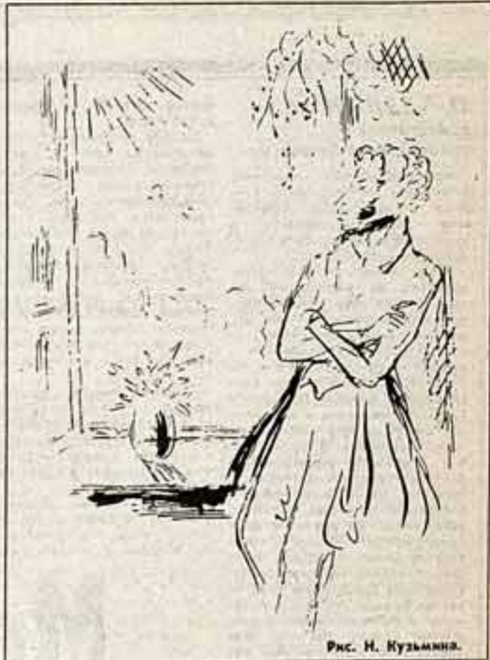
Рис. Н. Кузьмина.

шли знакомые комнаты и придумали танцевать. Запас известный танцев был невелик, и не все подходило к этому полутемному залу. Пушкинскому! Поскрипывали половики, стул и шуршал град за плотно закрытыми окнами. Скользили девичьи фигуры. Тут и появились подружки. Женщины попросили их любить за нее и ушла. Они устроились у входа. Вдруг потемнело, порыв ветра взвихрил пыль на дорожке и крыльце, что выходило к домику из сада с которого открывался вид на Сорочье и заречные дали. Гринул град. За белой стеной извещ и дождик, и река, и луга, и деревни за ней. Про туман говорят: «Вытунную руку не видно». Про град такого не скажут, вытунную руку не видно. Но дождик был под крышей, а от града, что сами заскискали через порог, слышали тем, что закрыли двери. И вот тут-то в сумраке пустого дома девчонки ощутили себя полными хозяйками. Обо-