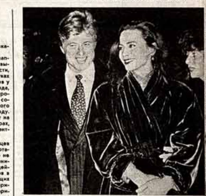
Премиера нового фильма режиссера Сидни Полака «Гангма» состоялась в Нью-Йорке. Фильм представляет собой последний актер американского кино Роберт Рэдфорд и восходящая звезда Лина Оливи.