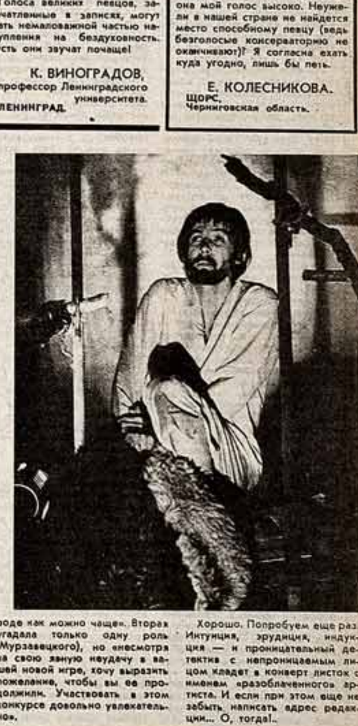
Полосу подготовила Г. УЮВА.

роде как можно чаще». Вториз угадала только одну роль (Муравецкого), но несмотря на свою злую неудачу в вазонной игре, хочу выразить пожелание, чтобы вы ее продолжили. Установить в этом конкурсе довольно увлекательное. Хорошо. Попробуем еще раз. Интуиция, эрудиция, индукция — и принципиальный детектив — с непроницаемым лицом кладет в конверт листок с именем «разоблаченного» артиста. И если при этом еще не забыть написать адрес редакции... О, тогда!