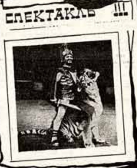
СПЕКТАКЛЬ Л. ШЕНГЕЛИЯ, народный художник РСФСР, лауреат Государственной премии СССР, художник-постановщик:

Внимание творческих организаций, совместных предприятий, зарубежных фирм, компаний и импресарио. Если вы хотите быть в нашей команде и помочь спектаклю «Спартак»: стать спонсором коллектива, организовать его гастроли в нашей стране или за рубежом, мы с благодарностью примем вашу помощь. Контактные телефоны: В Москве: 214-63-53, 285-39-95. В Ленинграде: 252-25-37. Адрес для контакта: Москва, Новослободская, 73, ТО «Эскарт». Телекс 114349 «Соль» Факс 292-65-11, BOX № 5445 for «Eskart»