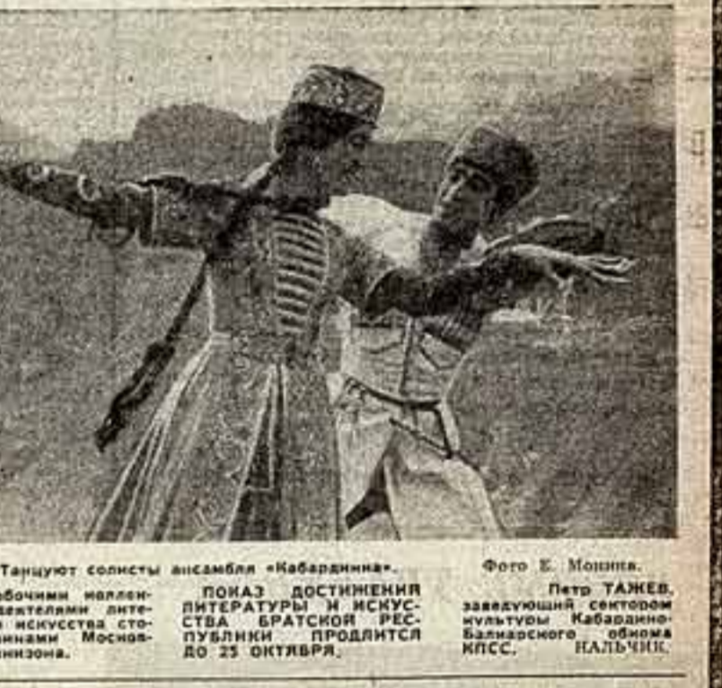
Танцуют солисты ансамбля «Набардинка» в ансамбле «Набардинка» танцевальном коллективе «Усадьба Купчиха» Нарьян-Интинского государственного театра драмы и балета Г. Савиной и Г. Исупова...

СЕГОДНЯ в МОСКВЕ НАЧИНАЕТСЯ ПОКАЗ ВОСТОРЖЕННОЙ ЛИТЕРАТУРЫ ИСКУССТВА НАБАРДИНО БРАТСКОЙ АССР. ПОСВЯЩЕННЫЙ 30-ЛЕТИЮ АВТОНОМНОЙ РЕСПУБЛИКИ.