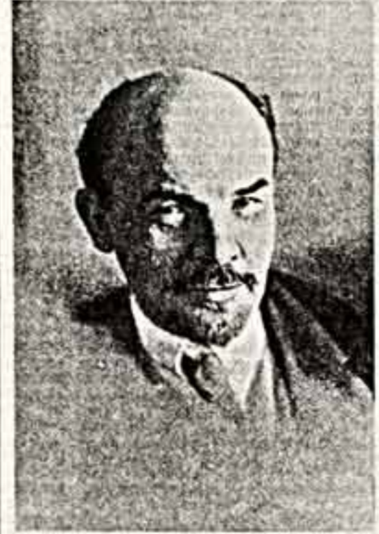
Рассказ тринадцатый. Снимок из 1918 года

Сегодня мы завершаем начатую год назад публикацию серии рассказов, повествующих об истории создания дореволюционных фотографий В. И. Ленина. Но на этот раз наш рассказ — о первом послеоктябрьском снимке Ильича, сделанном в январе 1918 года, спустя немногим более двух месяцев со дня победоносного свершения революции.