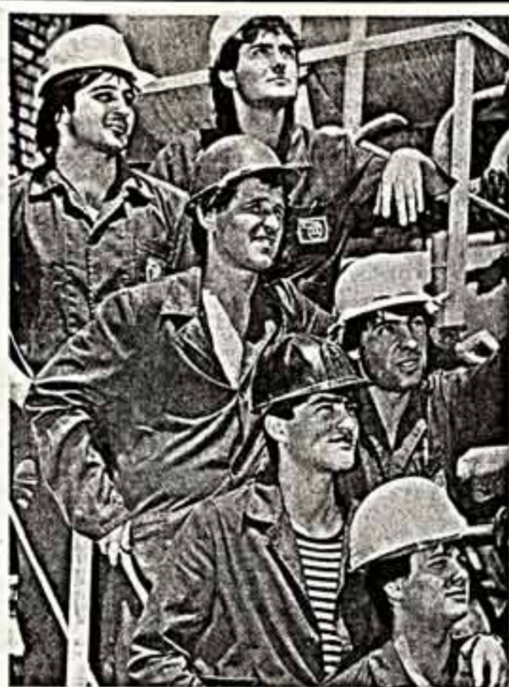
Молодые строители Болгарии.