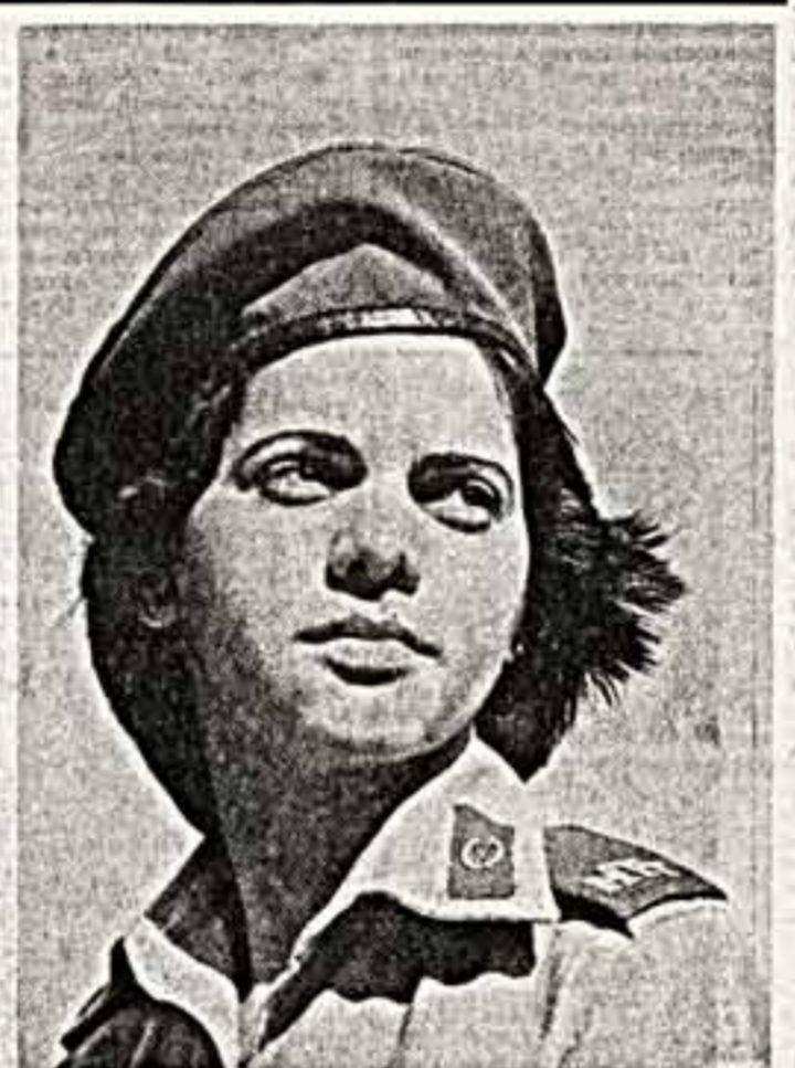
Студентка Гавайского университета.