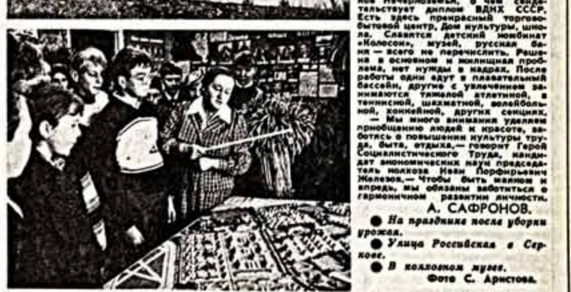
Кто хорошо живет, тот хорошо работает