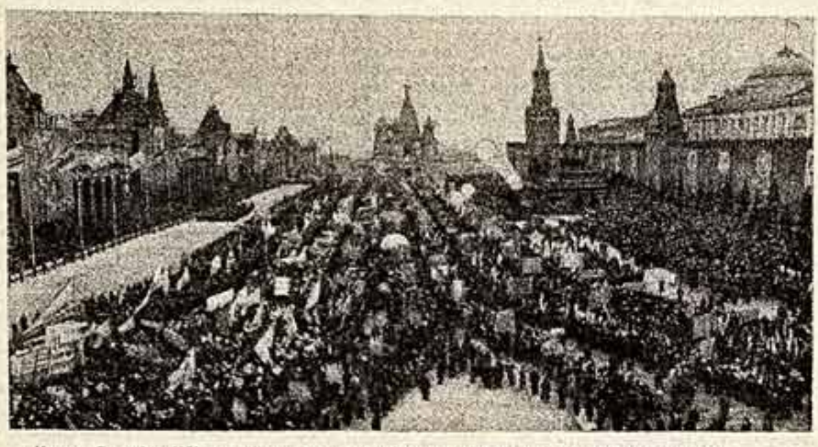
Москва. 7 ноября 1959 года. Демонстрация представителей трудящихся на Красной площади.

Вся страна, народы Советского Союза торжественно отпраздновали 42-ю годовщину Великой Октябрьской социалистической революции. Советские люди вновь продемонстрировали в эти дни свое монолитное единство с Коммунистической партией, всенародное одобрение внешней и внутренней политики партии и правительства, готовность и решимость приложить все силы и энергию, чтобы досрочно выполнить величественные задания семилетки.