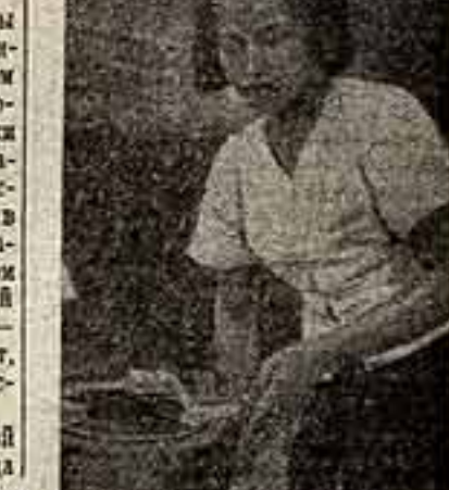
Национальный ганчарное производство.