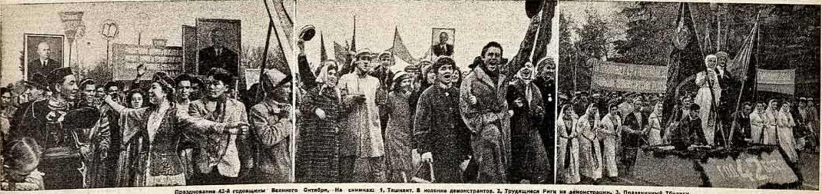
Празднование 42-й годовщины Великого Октября. На снимках: 1. Ташкент. В колонне демонстрантов. 2. Трудящиеся Риги на демонстрации. 3. Праздничный Тбилиси.

РАДОСТНО читать эти строки. Радостно сознавать, что миллионы друзей вместе с нами горят яркими победами. Сердечные пожелания народов-братьев открывают на новые славные дела во имя общей цели — коммунизма. Спасибо, друзья! Ваши надежды будут оправданы. Желаем вам также новых успехов и доброго здоровья».